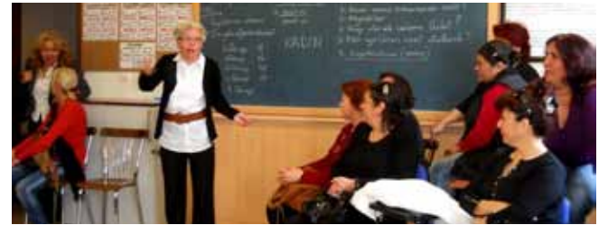
Tamamlanan beş KİHEP grubunun ortak toplantısından

Türkiye'nin doğusu, batısı, kuzeyi, güneyi ayırmadan; din, dil, ırk farkı gözetmeden, eğitim durumuna bakmadan sadece KADIN olarak bir araya gelerek ne yapabiliriz? Hem sorgulamak, hem eğlenmek, hem düşünmek, hem fikir alışverişi yapmak için bir aradayız.