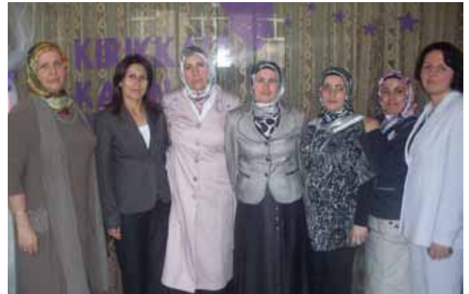
Kırıkkale Kadın Platformu Derneği’nin açılışı