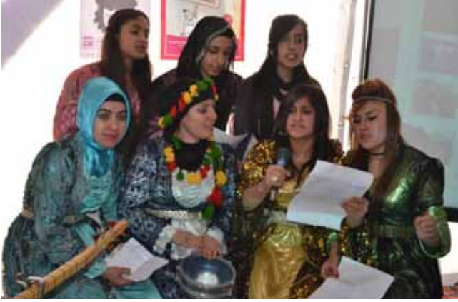
Kadın çadırındaki 8 Mart etkinliğinden.

Van’da bu yıl 8 Mart, kadın çadırında kutlandı. Van Kadın Derneği’nin (VAKAD) yaptığı basın açıklamasında, kadınların yıllardan beri süren mücadelesinin depreme rağmen aralıksız bir şekilde devam ettiği dile getirildi. Katılımın yoğun olduğu açıklamada şu sözlere yer verildi: