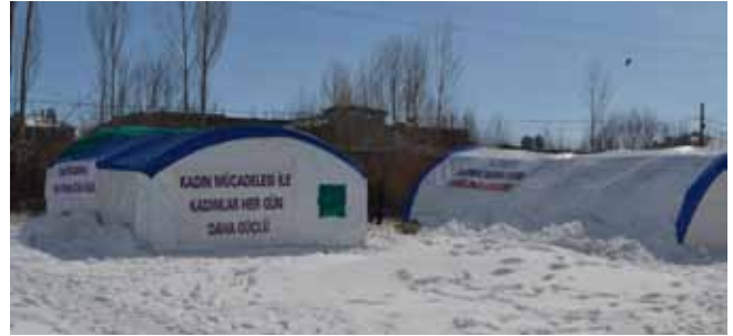
Bu yıl Van’da 8 Mart, bağımsız kadın çadırında kutlandı.