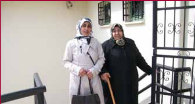
KİHEP aile içi iletişimi güçlendiriyor...

Denizli'de KİHEP'e daha önce katılmış olan kadınlarımızla yeni katılımcı kadınlarımız çeşitli etkinliklerde yer aldılar. ABD'de kadın haklarının doğuşunu anlatan Demir Çeneli Melekler film gösterimine katılan kadınlarımızın fotoğraflarını sizlerle de paylaşmak istedim. Fotoğrafta göreceğiniz gibi KİHEP'li gelin ve en büyük destekçisi kayınvalide kol kola film izlemeye gitti.