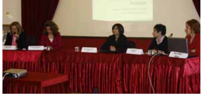
Panel katılımcıları şiddetin travmatik etkileri, cinsel şiddete karşı yasal hakları ve aile hukukundaki hakları ile ilgili bilgilendi.