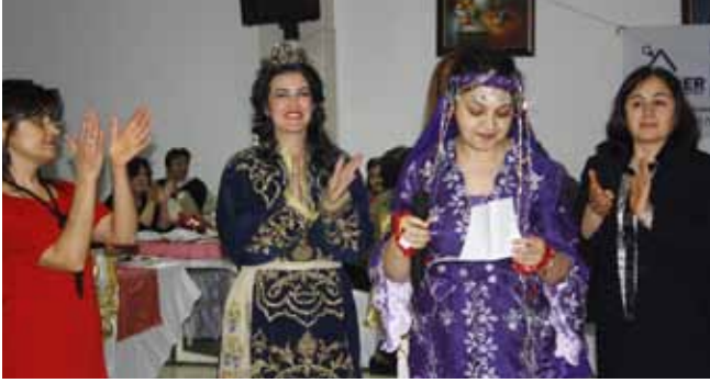
Geleneksel “Kına Gecesi”nde kadınlar tiyatro gösterisi, defile, şiiir ve müzik dinletisi ile kına yakma töreni eşliğinde eğlendi.

7 Mart: Toplumsal cinsiyet ayrımı ve eşitsizlikleri dönüştürmek amacıyla 10 yıldır düzenlenen, artık geleneksel etkinliğimiz olan “Kına Gecesi”ni gerçekleştirdik. Gecede üyelerimiz Kadının Adı Yok isimli tiyatro oyununu oynadı, üyelerimizin kızları hazırladıkları müzik dinletisini sundu, 1950’li yıllara ait kıyafetlerle şiiir eşliğinde bir defile yapıldı ve gecenin sonunda gelinimize geleneksel olarak kına yakıldı.