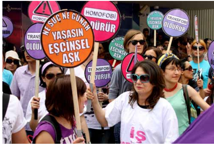
İlk kez Mayıs 2006'da gerçekleşen Uluslararası Homofobi Karşıtı Buluşma'nın bu yıl yedincisi yapılıyor.

Kaynak: Bianet (09.01.2012), Kaos GL (09.01.2012)