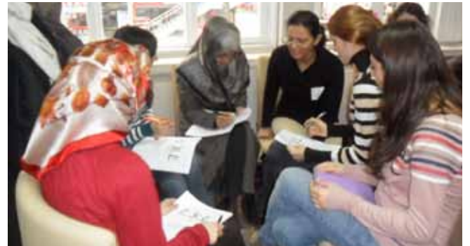
Kadının İnsan Hakları Eğitim Programı kapsamında kadınlar “Şiddete Karşı Stratejiler”i tartışıyorlar.