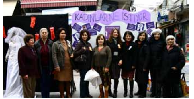
Sokak sergisinde kadınlar taleplerini yazıp "Kadınlar Ne İstiyor?" panosuna astı.