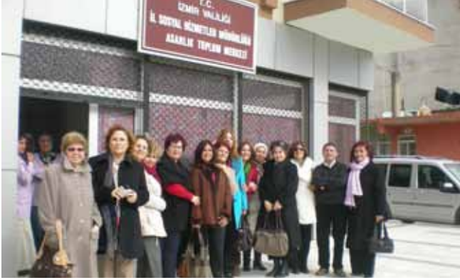
KİHEP'liler grup çalışması bittikten sonra da görüşmeye devam ediyor, sevinç ve üzüntülerini paylaşıyorlar...

KİHEP sonrasında yerel yönetimde kadın meclisinde daha etkin görevler aldım. Değişik komisyonlarda daha aktif çalışarak örgütlenmenin gerekliliğini yaşayarak öğrendim. Bir adım daha ilerleyerek yeni ilçe olan Bayraklı'da Türk Kadınlar Birliği'nin şubesini kurduk.