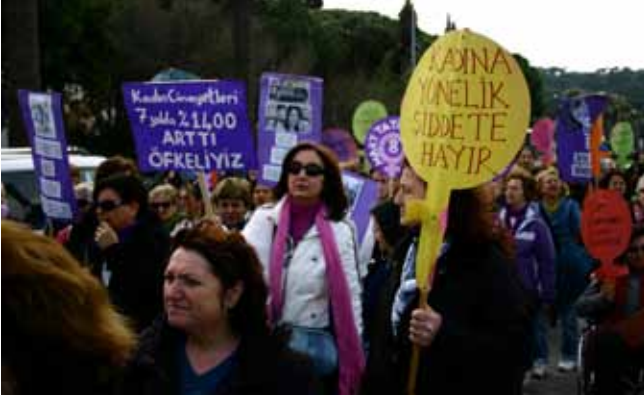
Ayvalıklı kadınlar 8 Mart'ta alanlardaydı.

Ayvalık Bağımsız Kadın İnisiyatifi ve ilçedeki diğer sivil toplum kurumu temsilcisi kadınlar bu yıl da bir araya gelerek 8 Mart Dünya Kadınlarının Birlik, Mücadele ve Dayanışma Günü için üç günlük etkinlik programı hazırladık. KİHEP katılımcısı olan arkadaşlarımızın her aşamasında yer aldığı etkinlikler 8 Mart günü Cumhuriyet Alanı'nda yaptığımız basın açıklamasıyla başladı. Gerçek eşitlik için, kadın emeğinin sömürsüne dur demek için, özgürlük için, kadın cinayetlerinin ve tacizin son bulması için alanlarda olduğumuzu söyleyerek, "Sahte şiddet yasasına itiraz ediyoruz", "Namus, aşk bahanesi hepsi kadın cinayeti", "Çocuk gelinlere hayır", "Kadını koruyan yasa istiyoruz", "Aile Değil Kadınıız" yazılı dövizlerimizle şiddet yasasına dikkat çektik.