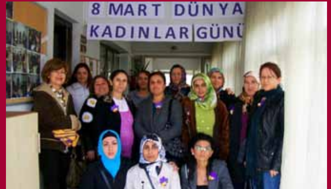
KİHEP katılımcıları 8 Mart'ta hep birlikte film izlediler.