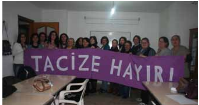
Farkındalık atölyesinin sonunda kadınlar “Tacize Hayır!” pankartı açtı.

Bir 8 Mart Dünya Emekçi Kadınlar Günü’nde sesi bizden olanlarla, yüreği bizden olanlarla bağırдық: 8 Mart’ı kadınların dayanıştığı, isyan ettiği gün olarak selamlıyoruz. Yaşasın kadın dayanışması!