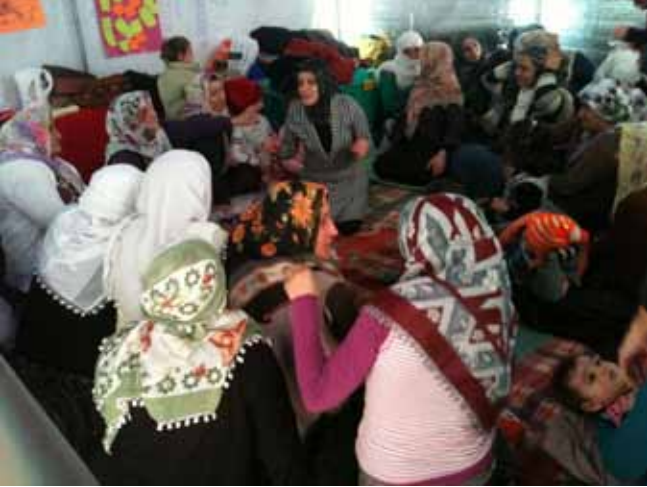
Kadınlar Muş Kadın Derneği, Van Mor Dayanışma ve İstanbul Feminist Kolektif'in ortaklaşa kurduğu kadın çadırında buluşuyor.