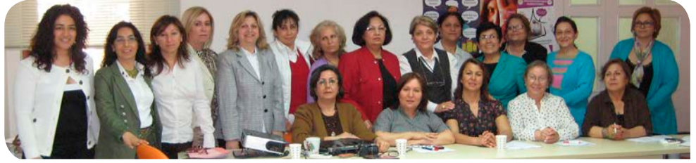
Adana'daki KİHEP grubu, Adana Kadın Danışma ve Sığınma Evi Derneği'nde (AKDAM) ve Türk Kadınlar Birliği'nde (TKB) örgütlü kadınların da katılımıyla gerçekleşti.