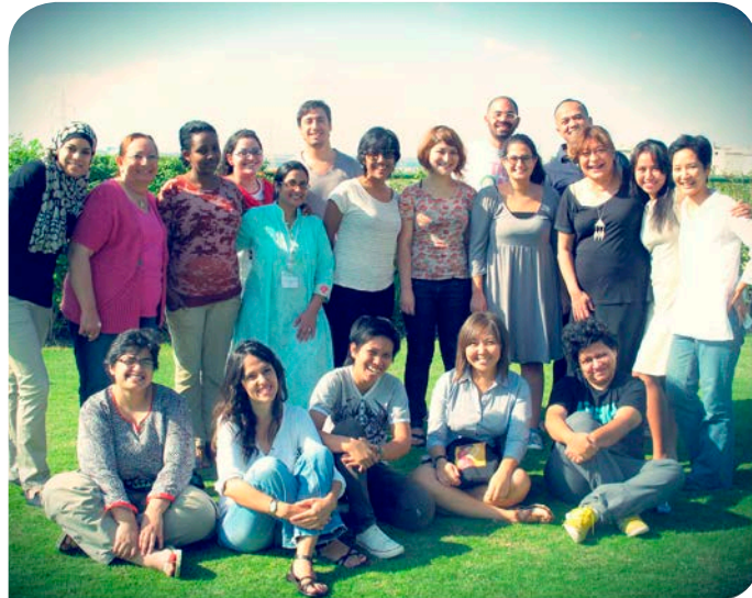
CSBR ile ilgili ayrıntılı bilgi için: http://www.csbronline.org

her ülke kendi deneyimlerini paylaşma fırsatı buldu. Katılımcı tüm ülkelerde muhafazakârlığın yükseliyor olması ve özellikle cinsel ve bedensel haklara yönelik tehditlerin ortaklaşması dikkat çekiciydi.