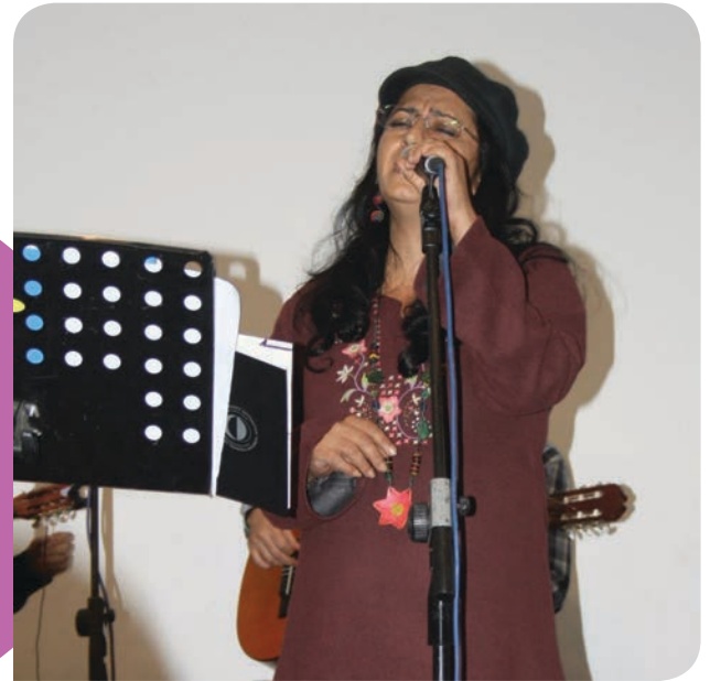
Grup Baria'nın sahne aldığı konser öncesinde, Kıbrıs'ta Kadına Yönelik Şiddet ve Sığınma Evi başlıklı bir bilgilendirme ve kadına yönelik şiddetle ilgili kısa film gösterimi yapıldı.

Feminist Atölye, sığınmaevine destek amacıyla bir süredir çeşitli faaliyetler yürütüyor. Bu çabaların bir parçası olarak 30 Kasım'da bir dayanışma konseri düzenledi.