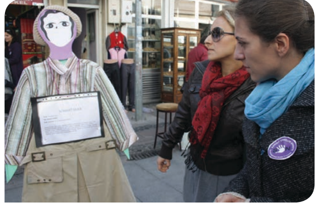
Sokak sergisinden bir kare. (Fotoğraf: Nilgün Kaya)

Ayvalık'taki kadın eyleminin haberini izlemek için: http://www.youtube.com/watch?v=gTjYmZ6nrM0 (Fotoğraf: Nilgün Kaya)