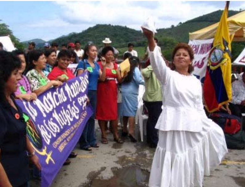
Ekvator'daki 8 Mart kutlamalarından bir kare

8 Mart Dünya Kadınlar Günü tüm dünyada olduğu gibi Türkiye'de de çok çeşitli etkinliklerle kutlandı. Kimimiz binlerce kadınla buluşup meydanlara çıktı "Kimsenin namusu olmayacağım" diye hep bir ağızdan bağırdı, kimimiz toplum merkezlerinde şenlikler düzenledi, kadınlığını kutladı. Kimimiz ellerinde meşaleler "Geceleri de istiyoruz, sokakları da" diye haykırarak sokak yürüyüşlerine katıldı, kimimiz kadınların yasal haklarıyla ilgili panellerde konuştu, kimimiz kamu kurumlarındaki görevlilere kadınların insan haklarının nasıl daha iyi korunacağını anlattı.