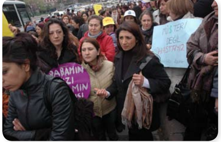
KİHEP'li kadınlar yeni SSGSS'ye karşı Ankara'da eylemdeydi.