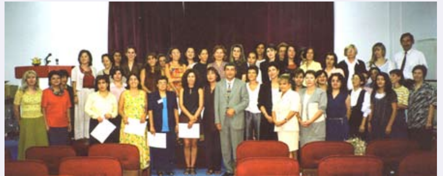
SHÇEK ile gerçekleştirdiğimiz ilk Eğitici Eğitimi, 1998

1995 yılından bu yana sahada uygulanan KİHEP, birbirinden özverili ve birbirinden becerikli eğitimcileri sayesinde son derece zengin bir program haline gelerek, Türkiye'nin dört bir yanında kadınların yaşamlarını dönüştürmelerine ve insan hakları ihlallerine 'Dur' demelerine katkıda bulunuyor. KİHEP Eğitici Eğitimleri'ne bugüne kadar Sosyal Hizmetler ve Çocuk Esirgeme Kurumu'na (SHÇEK) bağlı 107 meslek elemanı ve bağımsız kadın örgütlerinden 9 kadın katıldı.