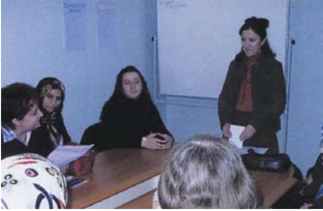
Sivas Valiliği'nin 2007 Faaliyet Raporu'nda KİHEP de vardı.

Kıymet'in Sivas'taki KİHEP grubu, düzenledikleri bir yemekli toplantıya yerel basın temsilcilerini de davet etti. Basın bültenleri dağıtan KİHEP katılımcıları basın mensuplarına KİHEP'i tanıttı. ♀♀