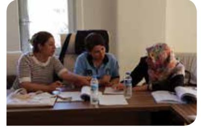
"Birbirinden öğrenen, güçlenen kadınlar" (KİH - YÇ)