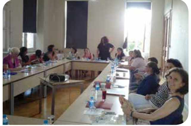
Derneğimizin 4. Genel Kurulu'ndan bir kare (KİH - YÇ)

Görev alan tüm arkadaşlarımıza teşekkür ediyor, birlikte kadının insan haklarının ve toplumsal cinsiyet eşitliğinin gerçekleştiği, korunduğu ve savunulduğu bir dünya için çalışacak olmaktan dolayı heyecan duyuyoruz.