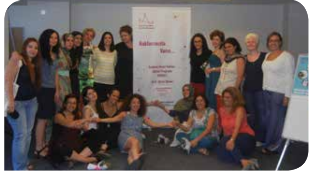
Toplantı hem keyifli hem verimli geçti (KİH – YÇ)

• Katılımcıların %36'sı ev içi ya da ev dışı gelir karşılığı bir iş yaptığını belirtmiş. Bu oran Türkiye ortalamasının üzerinde olsa da katılımcıların eğitim durumu göz önüne alındığında görece düşük kalmakta.