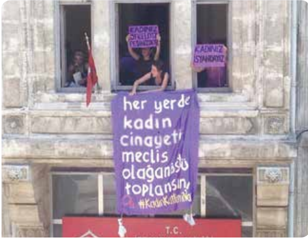
Kampanya'ya dair eylemlerden birinde kadınlar İstanbul Aile ve Sosyal Politikalar Bakanlığı İl Müdürlüğü'nü basarak pankart asıp basın açıklaması yaptılar.

Kadın ve LGBTİ örgütleri ile bazı feminist inisiyatiflerden oluşan 57 örgüt, siyasi partilerden, demokratik kitle örgütlerinden kadınlar ile bir araya gelerek, kadın ve trans cinayetlerine karşı birlikte ses verdik.