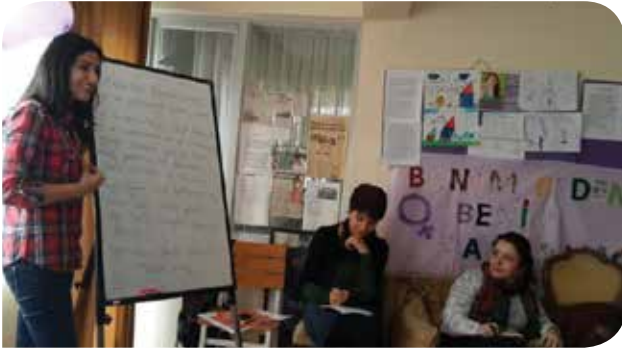
Grup yönlendiricilerimizden Gurbet'in ilk KIHEP grubundan bir kare

Gruptan iki arkadaş, evde kurdukları atölyelerinde bez çanta yapıp internet üzerinden satmaya başladılar. Adını MOR SAYFA koydukları -ki isim de grup arkadaşlarının kolektif bir çalışması sonucu ortaya çıktı- Facebook sayfası aracılığıyla küçük siparişler alıp satış yapıyorlar. Emeklerini işe çevirmeleri dayanışmanın en güzel göstergelerinden biriydi. Katılımcılardan bazıları KA-DER'in siyaset akademisine katıldı ve bu konuda artık onlar da eğitim veriyor. Özellikle Antalya yerelinin kadın konusunda çeşitlendirmeleri beni inanılmaz heyecanlandırıyor. Ayrıca grup katılımcılarının tamamı derneğe üye oldular ve gönüllü olarak faaliyet yürütüyorlar. Hukukçu kadınlar aldıkları gönüllü başvurular ve her anlamda sundukları destekle Antalya'nın yerel örgütlenmesi olan Antalya Kadın Danışma'ya güç kattılar, renk kattılar. Katılımcılardan bazıları var olan partilerde aktif siyaset yürütmeye başladılar ve geleceğe dönük olumlu planları var.