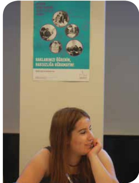
Hamide Özer-Hakkari Belediyesi Binevş Kadın Danışma Merkezi

Kadınlarla bir araya gelip bütün kadınların yaşamış ve anlatmış olduğu deneyimleri dinlemek beni çok bilgilendirdi; bu deneyimlerden faydalandım. KİHEP'te bütün kadınların ortak sorunlar yaşadığını ve kadınların yalnız olmadığını gördüm. KİHEP bana çok güç kattı.