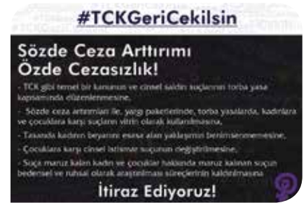
Şiddete Son Platformu'nun kampanya görsellerinden biri

aşırı derecede artırılmış olan cezalar yüzünden, özellikle aile içinde işlenen cinsel suçların şikayet ve ihbar edilmemesi ihtimalinin artması, bu yüksek cezalardan kurtulmaları için sanıklara haksız tahrik, iyi hal gibi indirimlerin yanlış bir şekilde uygulanmasına sebep olunması. Platform bundan sonra da yapılan değişikliklerin toplumsal cinsiyet eşitliğine uygun olarak tekrar düzenlenmesi için bunların takipçisi olacak.