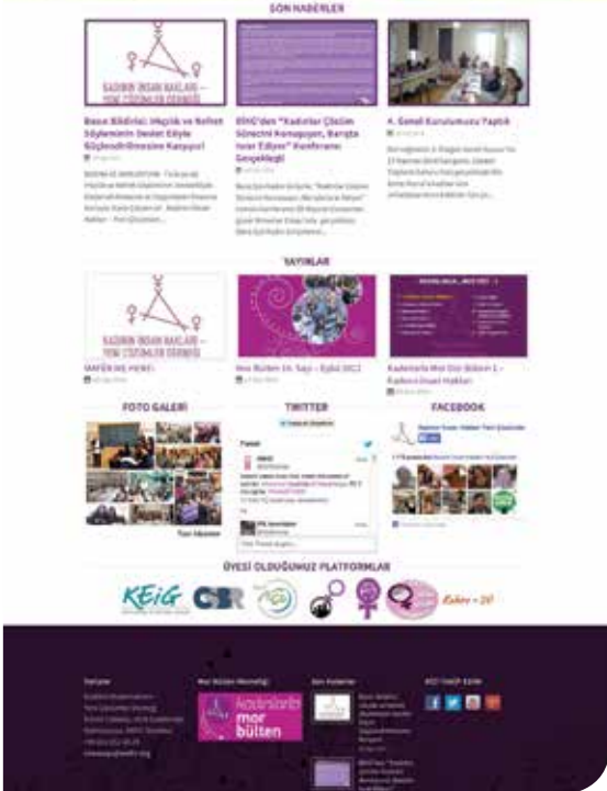
Sitemizin yeni görüntüsü