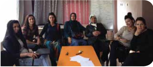
Daha güçlü bağlar kurabiliriz (KİH- YÇ)

KİHEP değerlendirme toplantısında, her kadın grubunu değerlendirirken, farklı bölgelerdeki kadınları daha iyi tanımaya başladığımı fark ettim, bu ise bana dünyadaki kadınlara yönelmem gerektiğini öğütledi. Tüm dünyadaki kadınları bir insan gibi düşünün. Eskiden insan elini tanırken, kırılan önyargılarım sayesinde, insanın elden ibaret olmadığını görmeye başladım. Saç uçlarından, ayak tırnaklarına kadar, bedenden bağımsız