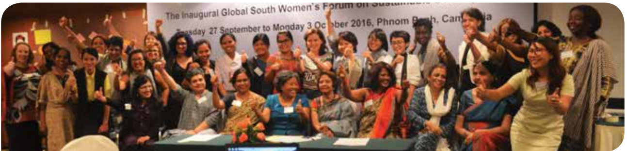
Küresel Güney Sürdürülebilir Kalkınma Kadın Forumu katılımcıları