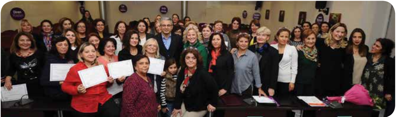
Izmir Karşıyaka Belediyesi Sertifika Dağıtımı ve KİHEP Protokol İmza Töreni

Sürdürülebilir Kalkınma Hedefleri'nin, BM Genel Kurulu'nda kabul edilmesinin üzerinden tam bir yıl geçti. KİH-YÇ olarak Sürdürülebilir Kalkınma Hedefleri'nin uygulanması, izlenmesi ve değerlendirilmesiyle ilgili uluslararası toplantılarda, Avrupa ve Asya'dan çeşitli kadın örgütleriyle bir araya geldik. Kısaca değindiğimiz bu konularla ilgili ayrıntılı yazıları ilerleyen sayfalarımızda bulabilirsiniz.