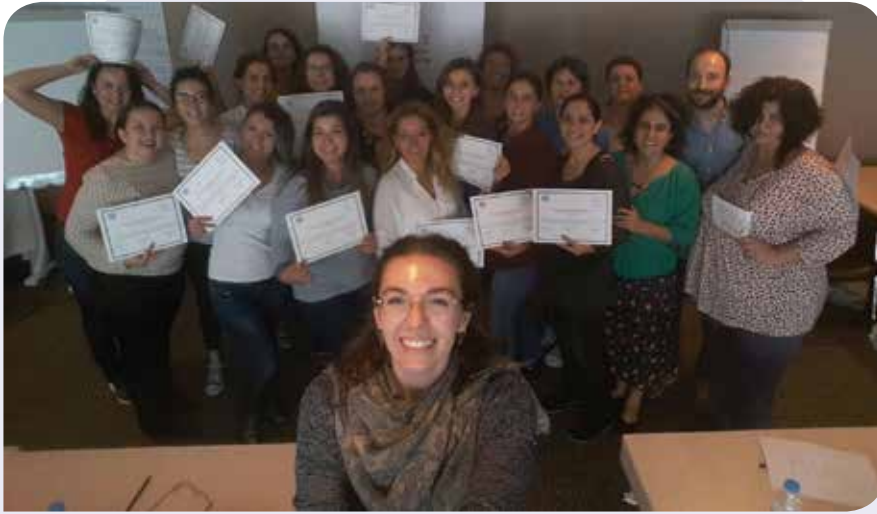
10. KİHEP Eğitici Eğitimi katılımcıları, ILO Temsilcisi Kadir Uysal ve KİH-YÇ ekibi

Projenin bir başka güzel sonucu da işbirliği yapılan belediyelerin kadın çalışanlarına yönelik olarak gerçekleştirilen 10. KİHEP Eğitici Eğitimi oldu. 3-14 Ekim 2016 tarihleri arasında gerçekleştirilen bu eğitici eğitimi ile Ankara Çankaya Belediyesi çalışanlarından 5, Bursa Büyükşehir Belediyesi çalışanlarından 4, Bursa Osmangazi Belediyesi çalışanlarından 5 ve İstanbul Kadıköy Belediyesi çalışanlarından 3 kişinin katılımıyla KİHEP eğitici ağına 18 yeni eğitici katılmış oldu. Her biri çalıştıkları belediyelerin bünyesinde KİHE ve KİHEP grup çalışmaları yürütecek bu yeni eğiticilerin aramıza katılması ile proje illerinde kadınların güçlenmesine ve örgütlenmesine katkı sunacak olmak bizi şimdiden heyecanlandırıyor.