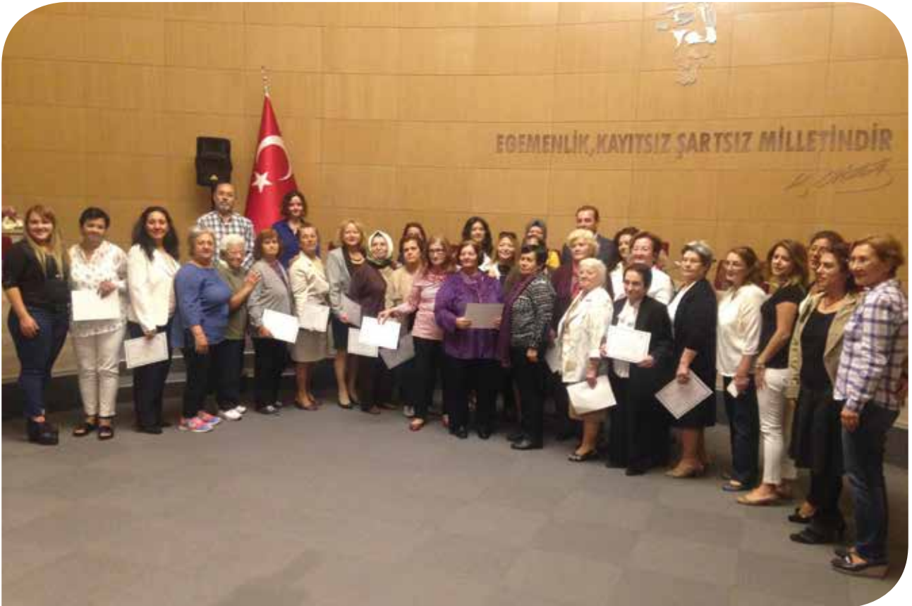
İzmir Gaziemir Belediyesi Sertifika Dağıtımı ve KİHEP Protokol İmza Töreni