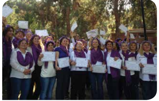
İzmir Balçova Belediyesi Sertifika Dağıtımı ve KİHEP Protokol İmza Töreni

Karabağlar Belediyesi ile de son derece olumlu giden süreci Ocak 2017'de tamamlayıp protokolü imzalayacağız.