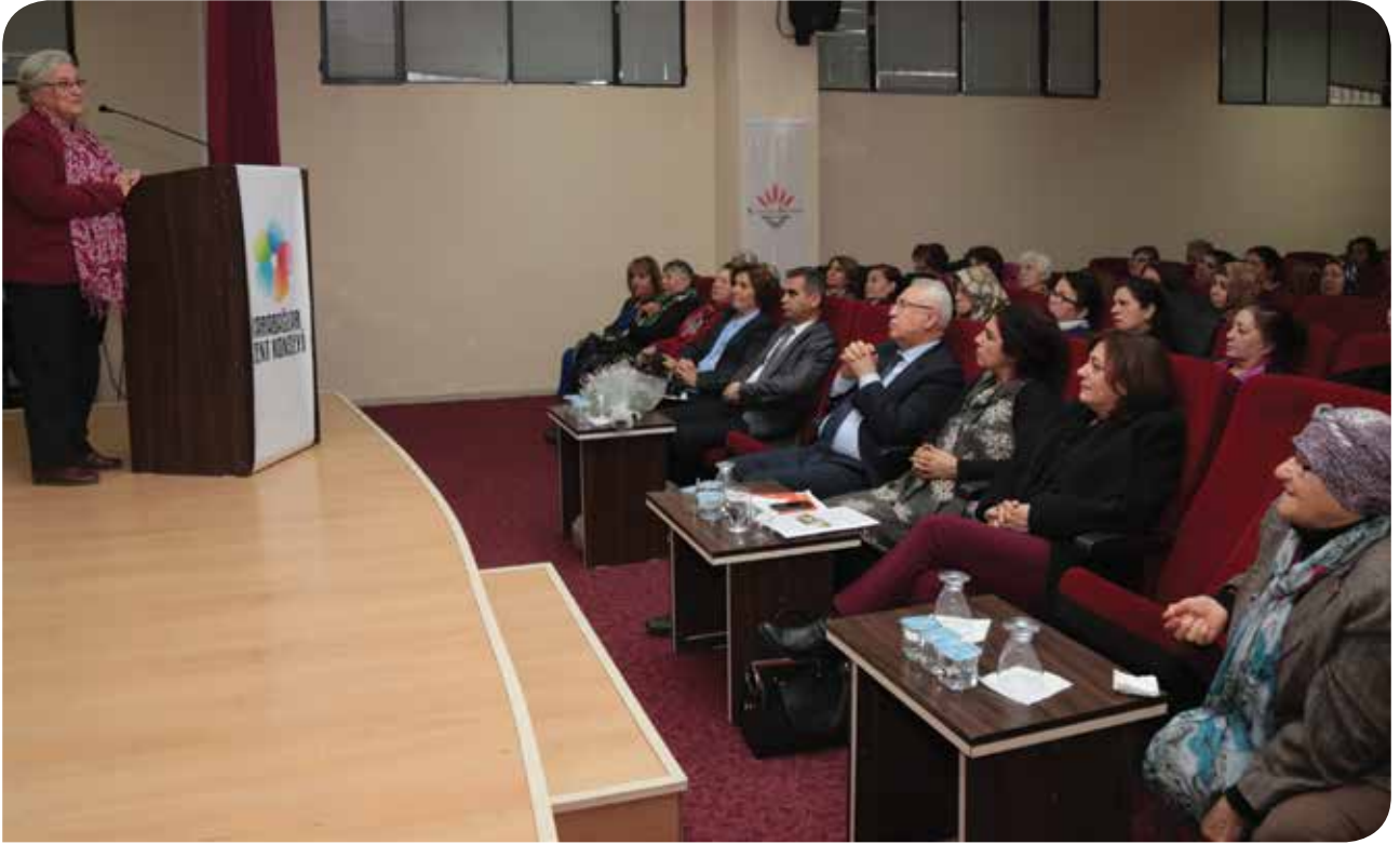
İzmir Karabağlar Kent Konseyi ve Belediyesi'nin düzenlediği KİHEP Şenliği ve Sertifika Dağıtım Töreni

Benim en çok etkilendiğim, KİHEP'li kadınların konuştukları zamanlar oldu. Mikrofon deneyimi olmayan kadınlar çok güzel konuşmalar hazırlamışlardı.