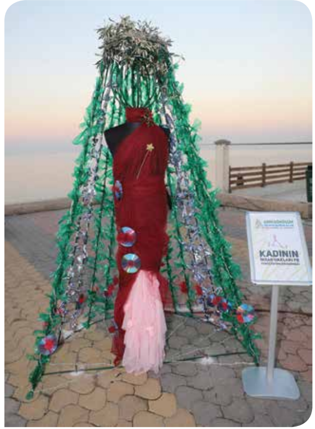
Güzelbahçe'deki KİHEP'li kadınların yaptığı geri dönüşümü ifade eden kadın figürü