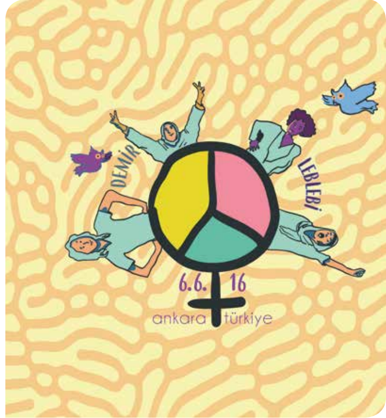
İllüstrasyon: Ali Çağan Uzman

İsteğimiz ülkenin her yanındaki, her kesimden kadınlarla bir araya gelip nasıl bir barış istediğimizi ve nasıl barışacağız konuşmak. Barış dediğinizde herkes olsun diyor, çünkü barış istemek ahlaklı bir şey. Ancak nasıl barışacağız dediğinizde herkesin kendine göre bir “ama” cümlesi var. Barış gelsin ama... İşte o ama ile başlayan