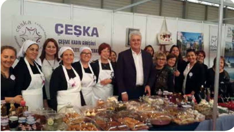
Çeşme Kadın Girişimi Üretim ve İşletme Kooperatifi - ÇEŞKA'lı Kadınlar