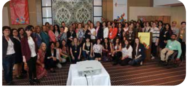
“Karşılaşmalar: Sürdürülebilir Kalkınma Hedefleri ve Toplumsal Cinsiyet Eşitliği Buluşması”nda farklı alanlarda çalışan STK temsilcileri bir araya geldi

KİH-YÇ’nin 1 Haziran 2017’de İstanbul’da gerçekleştirdiği “Karşılaşmalar: Sürdürülebilir Kalkınma Hedefleri ve Toplumsal Cinsiyet Eşitliği Sivil Toplum Buluşması”nda farklı alanlarda çalışma yürüten sivil toplum kuruluşu (STK) temsilcileri bir araya geldi. Toplantıda, SKH’lerin yerelleştirilmesi ve farklı çalışma alanlarında toplumsal cinsiyete duyarlı bir biçimde uygulanması ve izlenmesi konuları ele alındı.