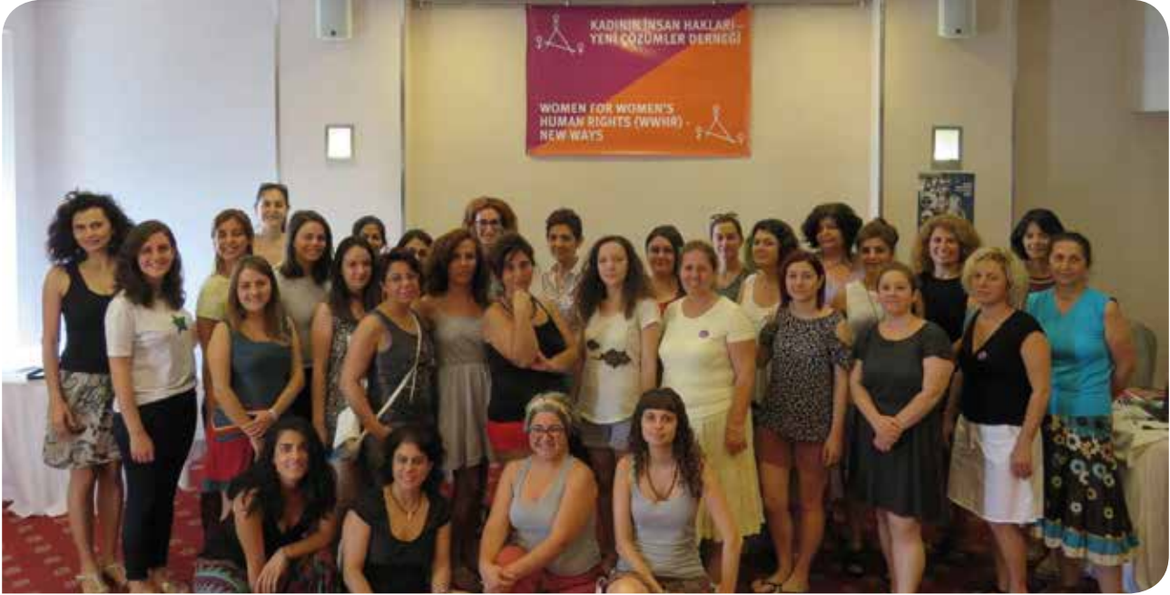
11. KİHEP Eğitici Eğitimi katılımcılarımıza ilk grup çalışmalarında başarılar diliyoruz