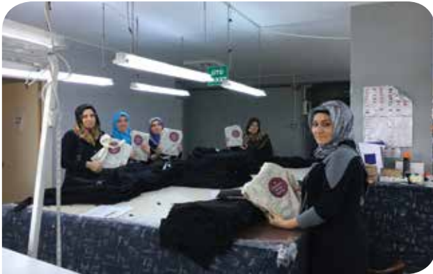
Modernteks Hazır Giyim, Akyıldız Tekstil ve Coşkun Moda'ya ait tekstil atölyelerinde çalışan kadınlara Haklarımız Var serisi kitapçıkları dağıtıldı

Protokollerin imzalanması sürecinde desteklerini esirgemeyen belediye başkanlarımıza, başkan yardımcılara, belediye yetkililerine ve aynı zamanda bu süreçte yoğun emek veren KİHEP eğitimcilerimize ve tabii KİHEP'i canlı tutan KİHEP katılımcısı tüm kadınlara sonsuz teşekkür ediyoruz.