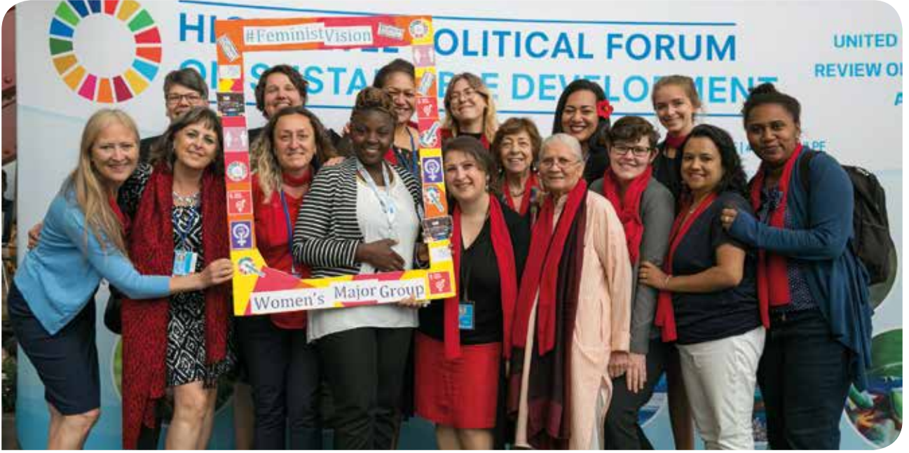
Sürdürülebilir Kalkınma Hedefleri'nin izleme mekanizması Üst Düzey Politik Forum (HLPF) 2017