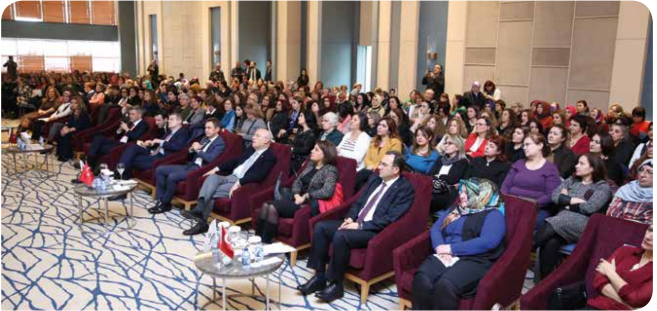
Uluslararası Çalışma Örgütü (ILO) Türkiye Ofisi ile ortak çalışmamızın kapanış toplantısı

Bununla birlikte, bizler de kadınların eşitlik mücadelesinde özellikle son 40 senede büyük rol oynayan Türkiye kadın hareketinin bir parçası olarak, yapmakta olduğumuz işlere devam etmeyi bu noktada özellikle önemli buluyoruz. Zira hak mücadelesi, ulusal ve uluslararası yasalarda tanınmış temel demokratik bir haktır. Bu kapsamda son aylarda yürüttüğümüz bazı faaliyetleri sizlerle kısaca paylaşmak istiyoruz.