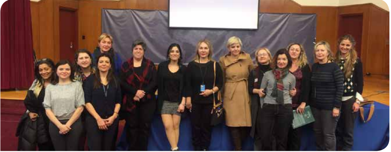
Birleşmiş Milletler 61'inci Kadının Statüsü Komisyonu kapsamında gerçekleştirdiğimiz “Mor Ekonomi” paneline yurt dışından ve Türkiye’den çok sayıda kadın katıldı

Birleşmiş Milletler (BM) Kadının Statüsü Komisyonu 1 (KSK) toplantılarının 61'incisi 13-24 Mart 2017 tarihlerinde New York'ta gerçekleştirildi. Toplantı kapsamında, KİH-YÇ ve BM Kadın Birimi (UN Women) tarafından gerçekleştirilen oturumda, yeşil ekonominin tamamlayıcısı niteliği taşıyan ve bakım emeğinin de sürdürülebilir kılınmasını amaçlayan “Mor Ekonomi” 2 kavramı etraflıca tartışıldı.