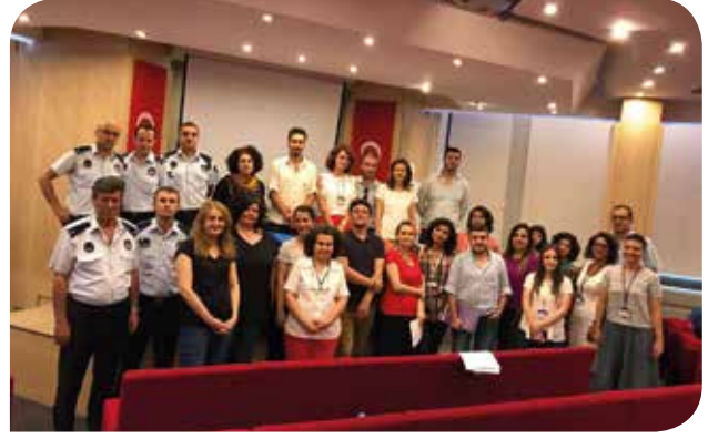
Kadıköy Belediyesi çalışanlarıyla gerçekleştirdiğimiz Toplumsal Cinsiyet Eşitliği Semineri