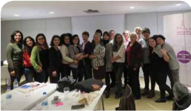
Sürdürülebilir Kalkınma Hedefleri Biz Bize toplantısına kadın hakları alanında çalışan 20’den fazla kadın katıldı.

Katılımcılar, önceliğin Hedef 5’e (“toplumsal cinsiyet eşitliğini sağlamak ve kadınların ve kız çocuklarının toplumsal konumlarını güçlendirmek”) verilmesi konusunda ortaklaştı. Sürdürülebilir Kalkınma Hedefleri’nin savunuculuğunu yaparken uluslararası kurum ve örgütlerle dayanışma ağlarının ve feminizmin ulusal ve uluslararası düzeyde politik alanlara doğru söz söylemesinin önemi vurgulandı. Ayrıca yerel dinamikleri ve riskleri göz önüne alarak belli göstergeler dahilinde hedeflerin izlenmesinin yapılması, bilgiyi yaymak için farklı yöntemler geliştirilmesi, bunun için feminist bir dil kurulması ve yerelin de bilgilendirilerek iş birlikleri yapılması da özellikle öne çıkan fikirler arasındaydı.