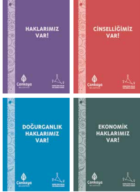
Haklarımız Var serisi kitapçıklarımız Çankaya Belediyesi'ne nikah başvurusunda bulunan çiftlere dağıtılıyor

KİH-YÇ olarak KİHEP grup çalışmalarımızda kullandığımız Haklarımız Var Serisi'ndeki 4 kitapçık ( Haklarımız Var , Ekonomik Haklarımız Var , Cinselliğimiz Var ve Doğurganlık Haklarımız Var ) ve KİHEP tanıtım broşürünü Çankaya Belediyesi ile iş birliği içinde çoğalttık. Çankaya Belediyesi'nin Kadın ve Aile Hizmetleri Müdürlüğü ile ortak yürüttüğümüz bu çalışma kapsamında, bu 4 kitapçığımızı belediyeye nikah başvurusunda bulunan çiftlere dağıtılmak üzere 3000'er adet bastırdık. Yayınlarımız Temmuz ayı itibarıyla, nikah için belediyeye başvuran çiftlere dağıtılmaya başlandı. Çankaya Belediyesi ile bu önemli ve anlamlı iş birliğine 2018 yılında da devam etmeyi planlıyoruz. Kadınların güçlenmesi ve haklarıyla ilgili daha aktif rol olmaları konusundaki katkı ve desteği için Çankaya Belediye Başkanı Sayın Alper Taşdelen'e, Başkan Yardımcısı Gülsün Bor Güner'e, Kadın ve Aile Şube Müdürü Ülkü Karaalioğlu'na ve KİHEP eğiticilerimiz Aysun, Dide, Senem ve Seray'a çok teşekkür ediyoruz.