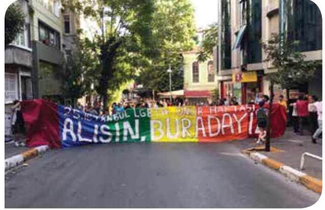
Cihangir'de pankart açılarak basın açıklaması okundu

Her şeye rağmen Onur Haftası Komitesi'nin basın açıklaması Taksim ve çevresinde sokaklarda, kafelerde