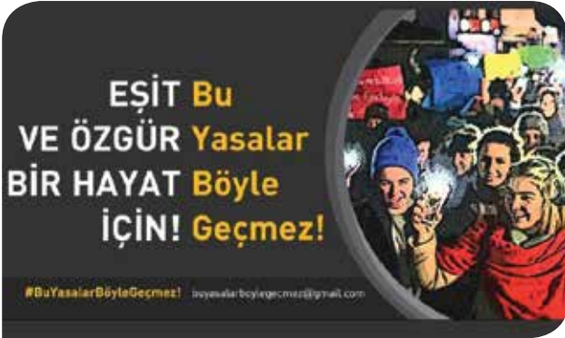
"Bu Yasalar Böyle Geçmez!" Kampanyası

Türkiye bu sene, kısaca İstanbul Sözleşmesi olarak bilinen “Kadınlara Yönelik Şiddet ve Ev İçi Şiddetin Önlenmesi ve Bunlarla Mücadele Hakkındaki Avrupa Konseyi Sözleşmesi”nin uygulanması konusunda ilk değerlendirme sürecine girdi ve Temmuz 2017’de ülke raporunu, değerlendirmeyi yapacak GREVIO Komitesi’ne sundu. Kadınlara yönelik şiddetin önlenmesi için İstanbul Sözleşmesi’ne taraf devletlerin taahhüt ettikleri uygulamaların izlenmesi açısından kritik olan ülke gözden geçirme süreçlerinde sivil toplum kuruluşları da Komite’ye gölge rapor sunabiliyor. Dernek olarak bizim de bileşenlerinden olduğumuz İstanbul Sözleşmesi Türkiye İzleme Platformu da bu süreçte GREVIO Komitesi’ne bir gölge rapor sundu. Ön hazırlıkları, yazımı, düzeltisi ve çevirisi 5 ay süren gölge rapor, Eylül ayında tamamlanarak Komite’yle paylaşıldı. KİH-YÇ olarak biz de bu süreçte aktif rol alan örgütlerden biriydik. Yine Türkiye’nin gözden geçirilmesi kapsamında Kasım ayında GREVIO Komitesi temsilcileriyle gerçekleştirilen toplantıya katılarak İstanbul Sözleşmesi’nin uygulanmasına yönelik görüşlerimizi komite temsilcileriyle paylaştık. Komite’nin Türkiye’nin ilk değerlendirme süreciyle ilgili nihai Değerlendirme Raporu’nu Eylül 2018’de yayınlıyacağı öngörülüyor.