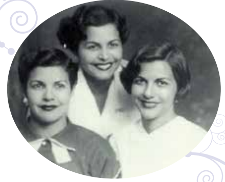
Mirabal kız kardeşler