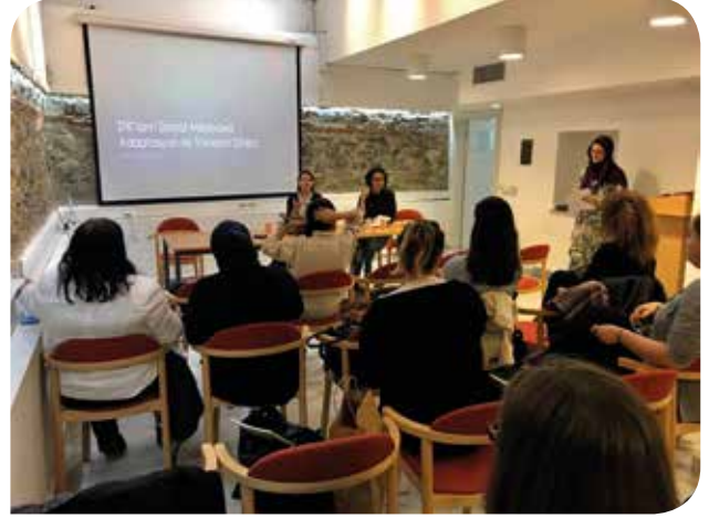
“Sivil Toplum Haberciliği: Kadın/LGBTİ+ Odaklı STK’larla Habercilik Çalıştayı” 2 Kasım’da İstanbul’da gerçekleşti