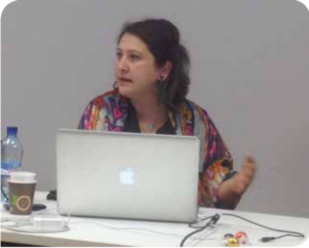
Lozan’daki sempozyumda Türkiye’deki kürtaj politikaları üzerine bir sunum gerçekleştirdik