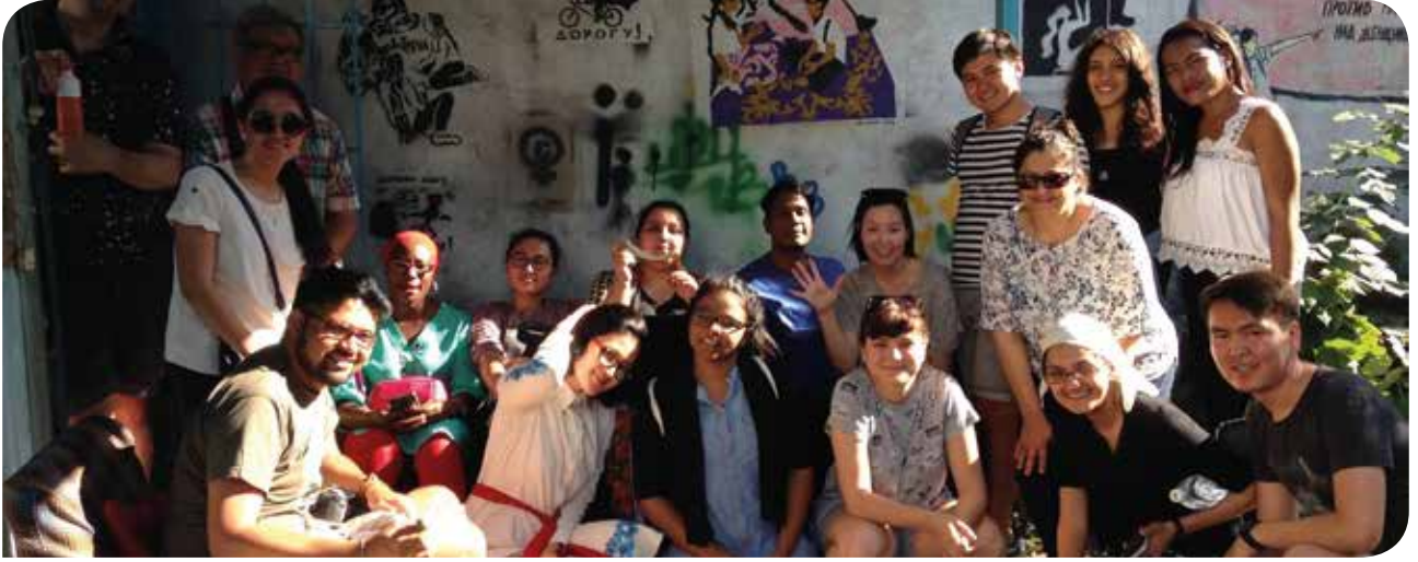
Aktivistler, STK temsilcileri ve akademisyenler 9. Cinsellik Enstitüsü'nde bir araya geldi

Müslüman Toplumlarda Cinsel ve Bedensel Haklar Koalisyonu (CSBR) tarafından bu yıl 9'uncusu düzenlenen Cinsellik Enstitüsü'ne KİH-YÇ olarak katılım sağladık. Kurucuları arasında KİH-YÇ'nin de bulunduğu CSBR, cinsel ve bedensel hakları savunuyor ve 15 yılı aşkın bir süredir Kuzey Afrika, Orta Doğu, Orta ve Güney Asya'dan feminist ve LGBTİ+ örgütlerinin katılımıyla genişleyen bir dayanışma ağı olarak varlığını sürdürüyor. CSBR, 2009'dan bu yana düzenlediği Cinsellik Enstitüsü'yle Müslüman toplumlarda cinsellik, cinsel sağlık, doğurganlık sağlığı ve hakları alanında teori ve pratiği birleştiren bütüncül ve disiplinler arası bir anlayışı benimsiyor. Enstitü'ye katılan örgütlerin savunuculuk becerileriyle beraber farklı ülkelerde bu konular üzerinde çalışan örgütler arasında dayanışmanın geliştirilmesini hedefliyor. Daha önce Türkiye, Endonezya, Malezya, Nepal, Tunus ve Sri Lanka'da düzenlenen ve şimdiye kadar 35 ülkeden, 120 örgüt ve ağı katıldığı Enstitü, cinsel ve bedensel hakların Müslüman toplumlarda insan hakları olarak kabul edilmesi için savunuculuk ve örgütlenme çalışmalarını güçlendirmeyi amaçlıyor.