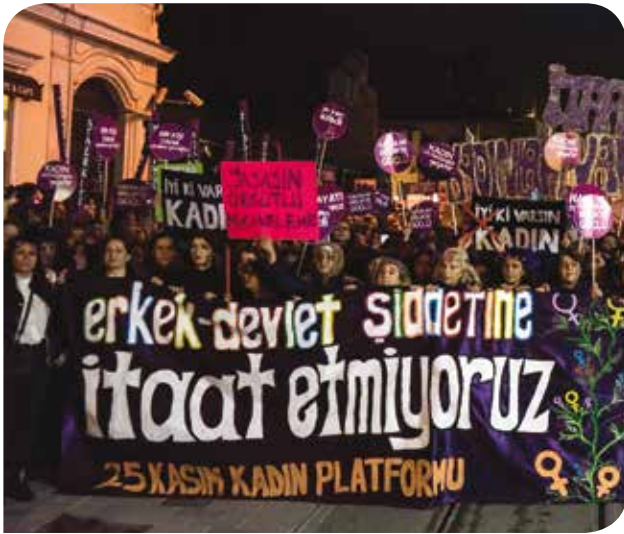
25 Kasım 2017’de İstanbul’da düzenlenen Feminist Gece Yürüyüşü

Böyle bir atmosferde, kocası tarafından fiziksel şiddete maruz bırakıldığı için mahkemeye başvuran bir kadının davasına bakan Mustafa Durmuş isimli hakim şu cümleyi kurdu: “Kadının sırtından sopası, karnından sıpası eksik edilmez”. Yasaların işlevi tüm vatandaşların haklarını eşit düzeyde korunmasını sağlamaksa bu hakim açıkça,