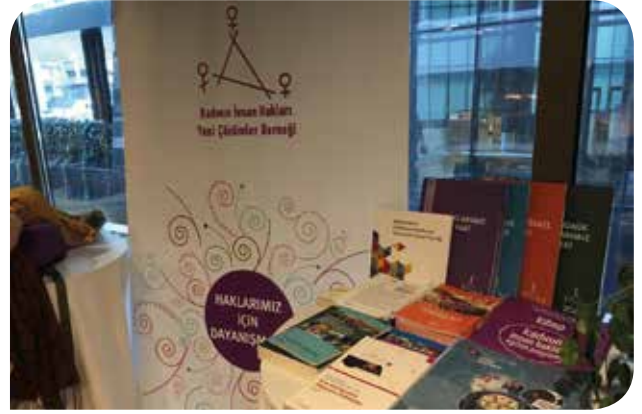
"Şiddete Nokta Koy Zirvesi"ndeki standımız

Toplumsal cinsiyet eşitsizliğini derinleştirecek, kadınlar üzerindeki baskıyı arttıracak olan ve kısaca “Müftülük Yasası” olarak bilinen Nüfus Hizmetleri Kanunu ile Bazı Kanunlarda Değişiklik Yapılmasına Dair Kanun Tasarısı ve Mağdur Hakları Kanun Tasarısı’na karşı “Eşit ve özgür bir hayat için bu yasalar böyle geçmez!” sloganıyla yola çıkan “Bu Yasalar Böyle Geçmez” Kampanyası’na KİH-YÇ olarak biz de destek verdik. Sosyal medya eylemlerinin yanı sıra çeşitli illerde sokak eylemleri ve 100’ün üzerinde kadın ve LGBTİ+ örgütünün imza koyduğu bir metinle, Ekim ayında meclise gelen “Müftülük Yasası”na karşı itirazlarımızı dile getirdik. Tüm itirazlara rağmen müftülüklere resmi nikah kıyma yetkisi verilmesi meclisten geçerken, kadın ve LGBTİ+ örgütlerinin taleplerinden ikisi dikkate alındı: Evlilik yoluyla vatandaşlığa geçiş kriterleri arasına eklenmek istenen “genel ahlak” kriterinden vazgeçildi ve sözlü