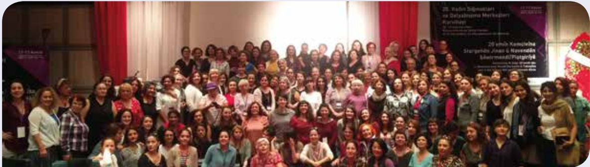
20. Kadın Sığınakları ve Da(ya)nişma Merkezleri Kurultayı