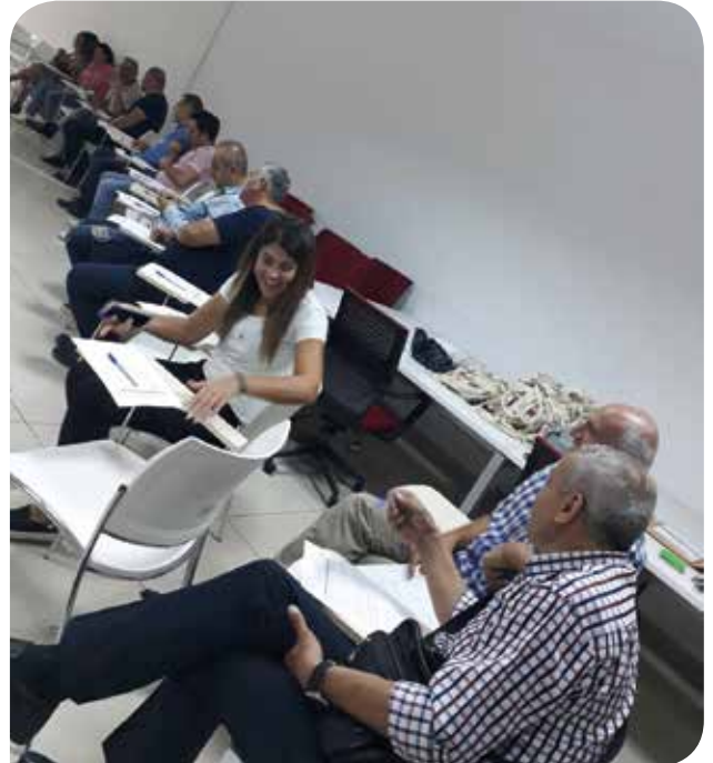
Karabağlar Belediyesi çalışanlarıyla "Toplumsal Cinsiyet Eşitliği" semineri

KİHEP Protokolü imzaladığımız Karabağlar Belediyesi'nin Kültür ve Sosyal İşler Müdürlüğü ile işbirliği içinde 80 kadın ve erkek belediye çalışanına yönelik "Toplumsal Cinsiyet Eşitliği Seminerleri"ni gerçekleştirdik. Eylül ayı sonunda gerçekleşen bu 3 seminer ile 2017 yılında toplam 27 seminer çalışması tamamlanmış oldu. "Toplumsal Cinsiyet Eşitliği Seminerleri"ne 2018 yılında da devam edeceğiz. Aynı zamanda bu seminerlerin etkisini ölçmek amacıyla bir değerlendirme çalışmasını hayata geçirmeyi de planlıyoruz.