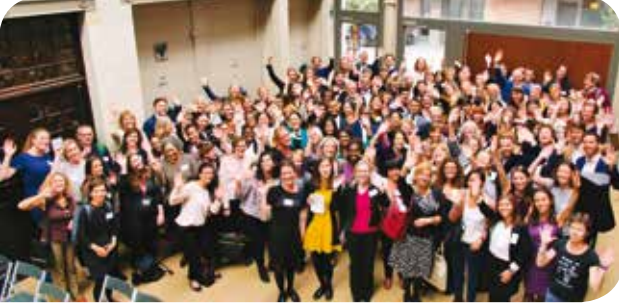
EuroNGOs yıllık konferansı 27-28 Eylül’de Brüksel’de gerçekleşti

“Popülizmin Yükseldiği Bu Dönemde Cinsellik ve Doğurganlık Sağlığı ve Hakları’nın Yaygınlaştırılması” başlıklı EuroNGOs yıllık konferansı bu yıl 27-28 Eylül tarihlerinde Brüksel’de düzenlendi. 33 ülkeden 200 kişinin katıldığı konferansta Avrupa’da ve dünyada artan popülizmin cinsellik ve doğurganlık hakları üzerinde olumsuz politik ve finansal etkileri, verinin önemi, inovatif yaklaşımlar, Sürdürülebilir Kalkınma Hedefleri’nin bu konudaki geriye gidişi azaltmaya yönelik olası etkileri, mevcut ve yeni savunuculuk araçları ve dili ile nasıl harekete geçilebileceği tartışıldı.