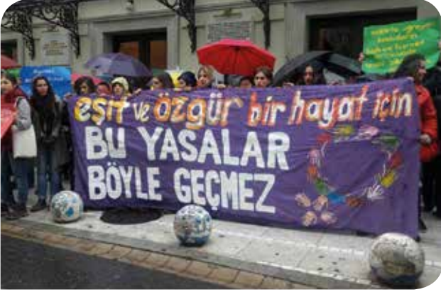
1 Ekim'deki "Bu Yasalar Böyle Geçmez" eylemlerinden

Mor Bülten 'in geçen sayısından bu yana kadının insan haklarına ilişkin öne çıkan konu, Türkiye'deki kadınların eşitlikçi ve seküler yasal haklarının geri alınması oldu. Kamuoyunda "Müftülük Yasası" olarak tartışılan yasa taslağı, TBMM'de kabul edildikten sonra 2 Aralık 2017 tarihinde Resmi Gazete'de yayınlanarak yürürlüğe girdi. Ayrıca, pek çok hak ihlalinin ve şiddetin her türünün OHAL koşullarında daha da arttığı bugünlerde, 6284 sayılı Ailenin Korunması ve Kadına Karşı Şiddetin Önlenmesine Dair Kanun gibi mücadeleyle kazandığımız kanunlar ile haklarımızı uluslararası düzeyde koruyan İstanbul Sözleşmesi'ne karşı tehditler de giderek artıyor.