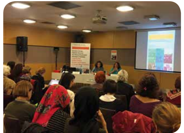
Kesişimsel feminizmin sunabileceği imkânların tartışıldığı konferansa ilgi büyüktü