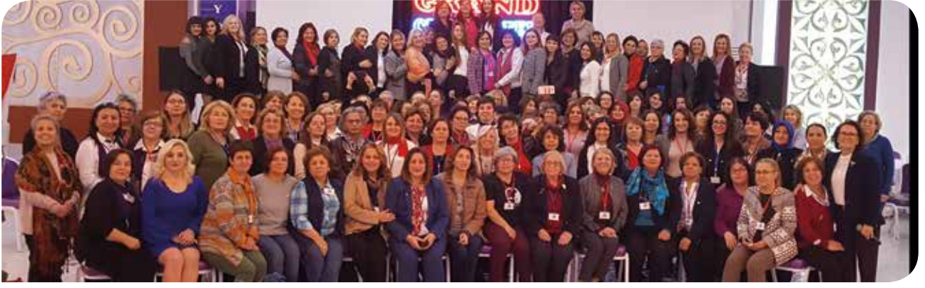
Kütahya'da gerçekleştirilen 11'inci Ege Kadın Buluşması'na 147 kadın katıldı