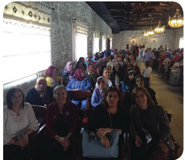
Altındağ Belediyesi KİHE Sertifikalı Töreni

Sadece katılımcılar değil Kadının İnsan Hakları-Yeni Çözümler Derneği, KİHE Koordinatörlüğü ve KİHE uygulayıcılarının desteği, dayanışması ve heyecanı da bana çok iyi geldi. Şiddet ve insan hakları ihlalleri ile yoğun karşılaştığımız bu günlerde bu özel dayanışma umut veriyor. Biliyorum ki “dünyayı, insani değerlere her koşulda bağlı kalan” ve “kadın farkındalığı olan” barışçıl kadınlar dönüştürecek.