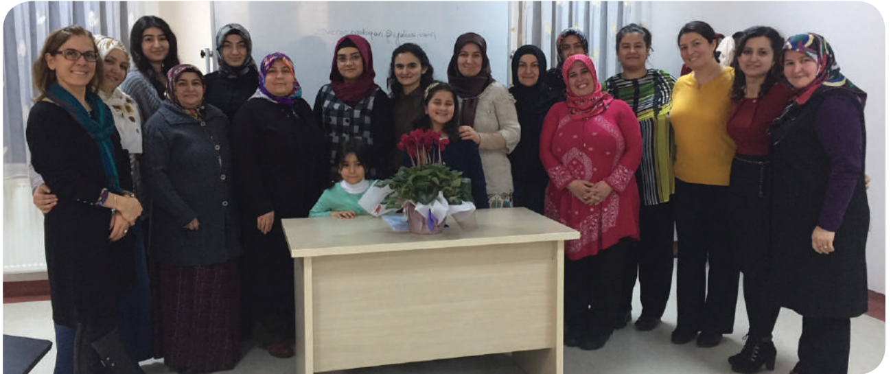
Ankara Altındağ Belediyesi Karapürçek 1 KİHE Grubu