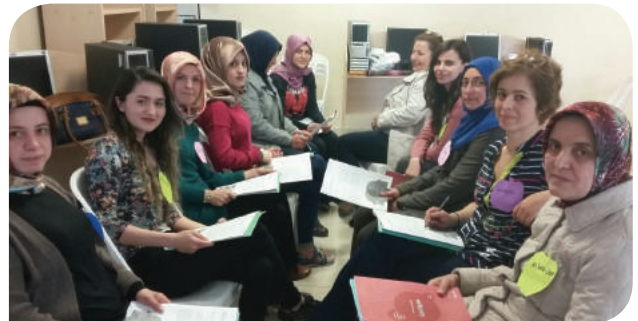
Bursa Osmangazi Soğanlı Kültür Merkezi KİHE Grubu