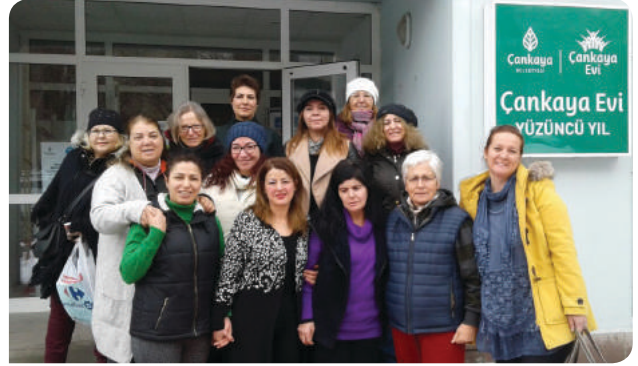
Ankara Çankaya Belediyesi Yüzüncü Yıl Çankaya Evi KİHE Grubu

Okuma-yazma bilmediği için utanan bir kadın, okuma-