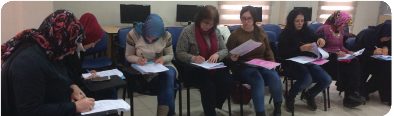
Bursa Büyükşehir Belediyesi Hanımlar Lokali KİHE Grubu