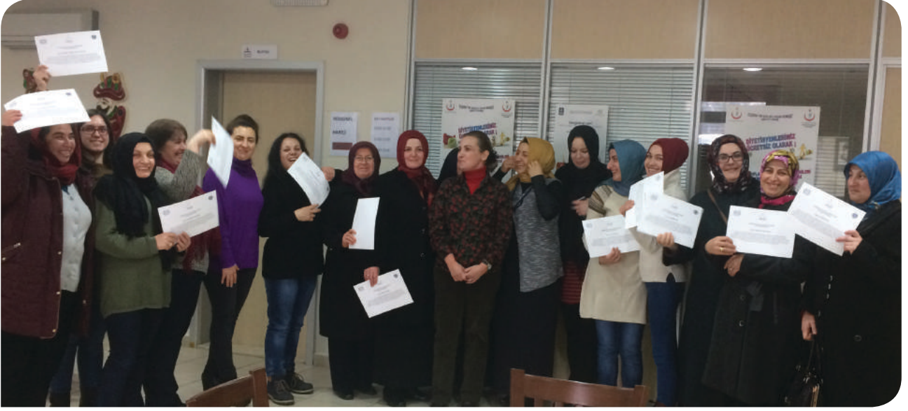
Bursa Büyükşehir Belediyesi Hanımlar Lokali KİHE Grubu sertifikalarını alıyor