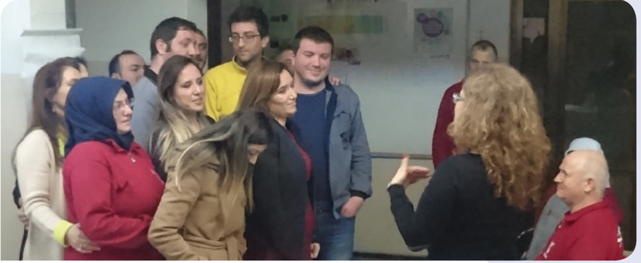
"Eşitliği Destekliyorum Semineri", Bursa