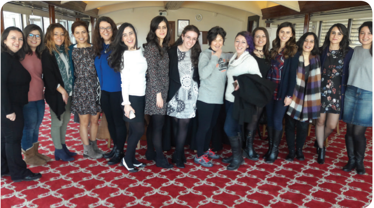
10. KİHEP Eğitici Eğitimi katılımcıları