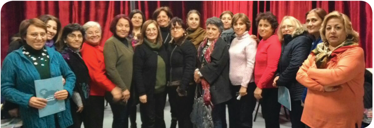
Ankara Yenimahalle Belediyesi Mesleki Eğitim Merkezi KİHE Grubu

Şiddet ve Şiddete Karşı Stratejiler modülleri en çok güçlendiğimiz bölümlerden ikisiydi. Katılımcıların 6284 Sayılı Kadına Yönelik Şiddetin Önlenmesine Dair Yasa hakkında ve şiddet karşısında yapabilecekleri ile ilgili bir bilgileri yoktu. Şiddet ile karşılaştıklarında başvurabilecekleri yerleri bilmiyorlardı ve KİHE sayesinde bu bilgileri edindiler.