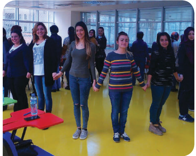
Bursa Osmangazi Belediyesi Soğanlı Kültür Merkezi KİHE Grubu

KİHE, şiddetin çözüm değil sorun olduğunu gün yüzüne çıkarmış, daha insanca ve barış içinde yaşamayı