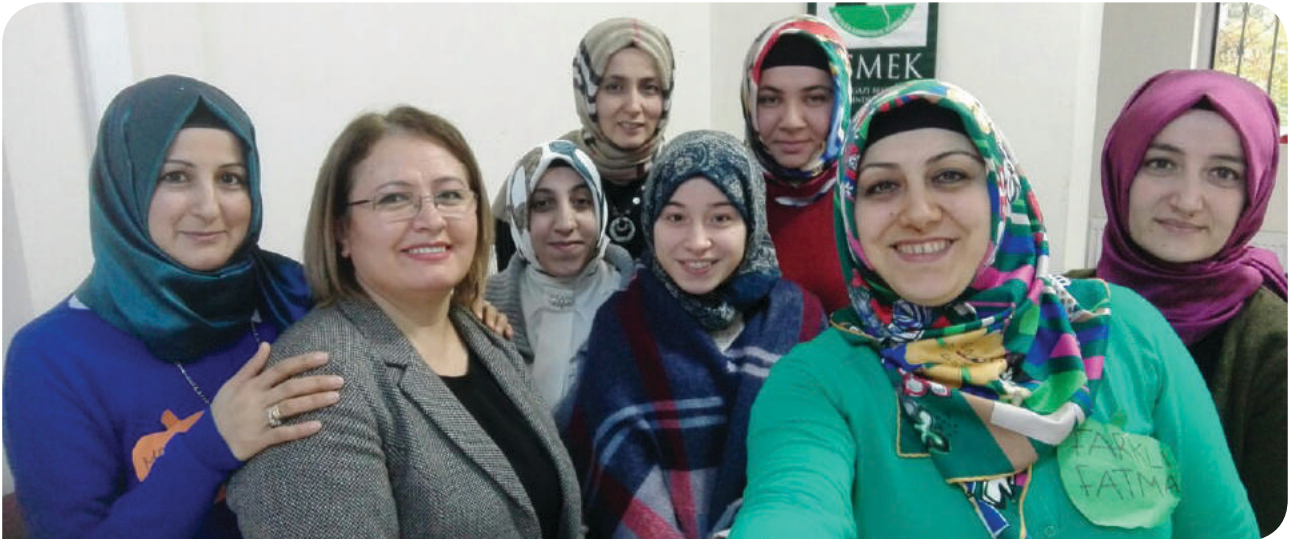
Bursa Osmangazi Belediyesi Emek Kültür Merkezi KİHE Grubu

Eylem Planının iki ana hedefi bulunuyor: Birincisi, kadın istihdamının artırılması için kadınlara mesleki beceriler