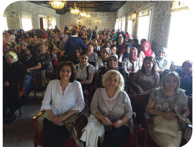
Altındağ Belediyesi KİHE Sertifika Töreni