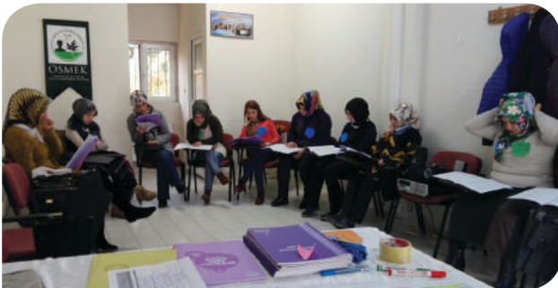
Bursa Osmangazi Emek Kültür Merkezi KİHE Grubu