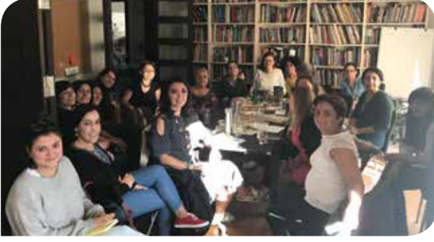
Nafaka Çalışma Grubu'nun İstanbul'daki toplantısı

Kadının insan hakları göz önüne alındığında kadın örgütleri ve kadınlar için zorlu geçen bir seneyi daha bitirirken, Türkiye'de demokrasi, hukukun üstünlüğü ve temel insan haklarının hâlâ tehlike ve tehdit altında olduğunu görüyoruz. Böylesi zor ve geriye gidişlerin yaşandığı zamanlarda temel hakları gözden çıkartılan grupların başında kadınlar geliyor. Bunun sonucunda ortaya çıkan ekonomik, siyasi ve toplumsal durağanlık ve kriz hali hepimizin hayatını son derece olumsuz etkileyebiliyor.