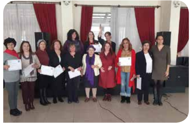
ÇEKEV KİHEP grubunun sertifika töreninden

Çiğli Kadın Platformu’nun KİHEP’li kadınların içinde olduğu bir grup kadın tarafından kurulmuş olması hem birlikteliğimiz ve dayanışma ilişkileri geliştirmemiz