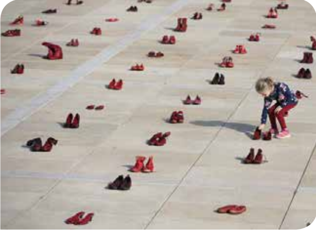
Kadına yönelik şiddete karşı İsrail'deki grevden

İsrail'de aralık ayı başında iki kadının öldürülmesiyle yıl boyunca öldürülen kadın sayısı 24'e yükseldi. Öldürülen kadınların çoğu öldürülmeden önce polise gidip can güvenliğinin tehdit altında olduğunu bildirmiş kadınlardı. Devletin kadın cinayetlerinin ve kadına yönelik erkek şiddetinin önüne geçmek için yeterli önlem almadığını söyleyen çoğu kadın 30 bin kişi, 4 Aralık Salı günü greve çıkarak ülkenin dört bir yanında eylemler düzenledi.