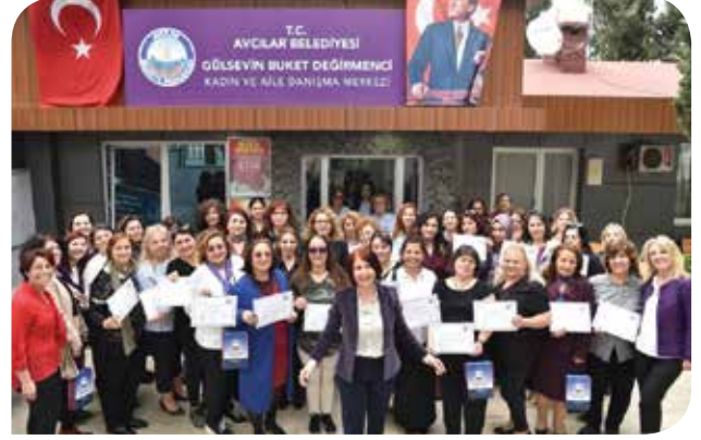
KİHEP gruplarını tamamlamış kadınlar Avcılar Belediye Başkanı Handan Toprak'tan sertifikalarını alırken

Çünkü ben kadınların eğitim almalarını çok önemli buluyorum. Kadınların eğitimlerle kendilerini geliştirmesi ve kız çocuklarının da okullarına devam etmeleri için desteklenmeleri gerektiğini düşünüyorum. Hiçbir kız çocuğu çocuk yaşta evlendirilmemeli ve her kadının