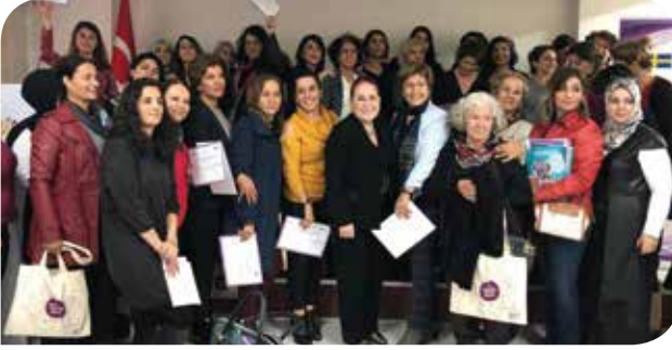
DOGÜNKAD'lı kadınlar ile gerçekleştirdiğimiz TCE Semineri