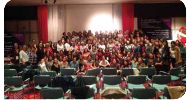
21'inci Kadın Sığınakları ve Da(ya)nışma Merkezleri Kurultayı katılımcıları