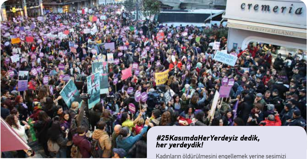
İstanbul'da kadınlar 25 Kasım yürüyüşünde

25 Kasım Kadına Yönelik Şiddete Karşı Uluslararası Mücadele Günü'nde, bu sene de her yıl olduğu gibi, kadınlar, Türkiye'nin dört bir yerinde sokaklara çıkarak erkek şiddetine karşı seslerini yükseltti. Adana, Ankara, Antalya, Antep, Artvin, Balıkesir, Bursa, Denizli, Dersim, Diyarbakır, Eskişehir, Hatay, İzmir, Kayseri, Kocaeli, Konya, Malatya, Manisa, Mersin, Muğla, Sakarya, Tekirdağ, Trabzon ve daha birçok yerde eylem yapıldı.