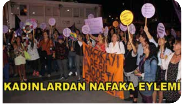
Bodrum Kadın Dayanışma Derneği'nin nafaka hakkı eyleminden

Yoksulluğa düşüp düşmeyeceği hakim tarafından detaylıca araştırılıp hükme bağlanmaktadır. Medeni Kanun yoksulluk nafakasının belirlenmesini hakim takdirine bırakmış ve nafakanın verilmesinde belli bir süre belirlememiştir.