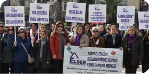
ELDER üyeleri 25 Kasım yürüyüşünde

çıkı. Hükümetin 100 günlük eylem planı kapsamında gündeme getirilen ve 2002 yılındaki yasal reform ile yürürlüğe giren yeni Medeni Kanun'un 175'nci ve 176'nci maddelerinde düzenlenen nafaka hakkına ilişkin, kadınlar lehine olamayacak bazı değişiklik önerileri gündeme geldi ve resmi kurumlar tarafından konuyla ilgili çalıştay ve toplantılar düzenlendi. Böyle önemli bir hakkın elimizden alınmaması için kadınlar ve kadın örgütleri olarak hemen harekete geçtik ve geçen sayımızda da yer verdiğimiz, pek çok kadın örgütünün imzasıyla basın açıklamasını yayınladık. Yine pek çok ilde kadınlar bir araya gelerek konuyla ilgili tepkilerini dile getirdiler. İstanbul'daki bazı kadın örgütleriyle Nafaka Çalışma Grubu'nu oluşturup konuyla ilgili bilgi dosyaları hazırladık ve yaygınlaşmasını sağladık. Öte yandan şu an için "evlilik ile ilgili konularda" yapılacağı söylenen yasal değişikliklerin önümüzdeki yerel seçimler sonrasına bırakıldığını duyuyoruz. Bu noktada, başta kadınlar olmak üzere herkesin bireysel ve toplumsal düzeyde eşit koşullara sahip bir yaşamı hak ettiğini savunmaya devam etmemiz ve kazanılmış haklarımızdan taviz vermememiz çok önemli, çünkü mevcut haklarımızın elimizden alınması bizleri daha da zorlu süreçlere sokabilir. Türkiye'de yapılan yasal düzenleme ve önerilerin kadınların haklarını geriletmek yerine, daha eşit koşullarda yaşamalarını sağlayacak şekilde yapılması gerekir.