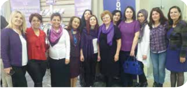
Avcılar belediyesindeki KİHEP gruplarından katılımcılar

Bugüne kadar çok okuyup çok dinlediğimi, çok donanımlı olduğumu zannedirdim. KİHEP neydi, bana ne katabilirdi, bilmediğim ne olabilirdi ki? Sadece bu sorulara cevap bulmak için katıldığım KİHEP grubunda anladım ki, KİHEP çok şeydi, hatta istisnasız her kadının alması gereken bir eğitim programıydı.