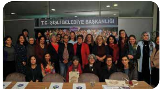
Şişli Belediyesi Kadın Gençlik ve Çocuk Merkezinin açılışı

Şişli Belediyesi, kadınlar, gençler ve çocukların güçlendirilmesini amaçlayan faaliyetleri doğrultusunda Kadın Gençlik ve Çocuk Merkezi'nin açılışını yaptı. Merkezde hem desteğe ihtiyaç duyan kadınlara hukuki, sosyal ve psikolojik destekte bulunulacak hem de Şişli'yi kadınlar için daha rahat yaşanabilir bir ilçe yapabilmek için faaliyetler yürütülecek. Kaldırımların düzenlenmesinden ilçenin ışıklandırılmasına, kaynakların kadınlar lehine kullanılmasının sağlanmasına kadar pek çok konuda yol gösterici politika üretilecek. Merkezin açılışına yıllardır kadın hareketine emek vermiş olan çok sayıda kadın katıldı. Merkez, Şişli Belediyesi'ne ait Nazım Hikmet Kültür ve Sanat Evi'nde çalışmalarını yürütecek.