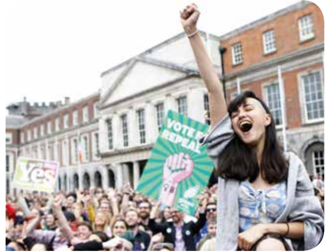
İrlanda'da kürtaj hakkı için gerçekleştirilen eylemden

Kürtaj yasağına ilişkin yıllar süren tartışmaların ardından aralık ayı içerisinde, İrlanda parlamentosu, 12 haftaya kadar kürtaja izin veren yasa tasarısını onayladı. Yasa 12 haftaya kadar kürtaja izin vermesinin yanı sıra gebeliğin ilerleyen dönemlerinde anne sağlığının tehlike altında olduğu durumlarda hamileliğin sonlandırılmasının önünü açıyor. Yasanın ocak ayı başında yürürlüğe girmesi bekleniyor.