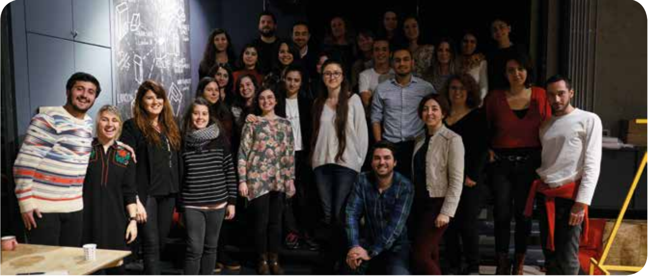
IMECE ile yaptığımız TCE Seminer katılımcıları