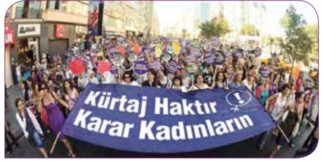
Kürtaj Haktır Karar Kadınların Platformu eylemi

Kürtaj olanağına erişim günden güne zorlaşırken 10 Eylül tarihinde İstanbul İl Emniyet Müdürlüğü, 1 Ocak 2017 ile 31 Mayıs 2019 tarihleri arasında İstanbul'daki tüm kamu ve özel hastanelerden 30-40 yaş aralığında "polistik over sendromu" olup, kürtaj yaptıran kadınların listesini resmi olarak istediğini öğrendik.