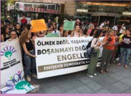
Emine Bulut eylemi, Eskişehir