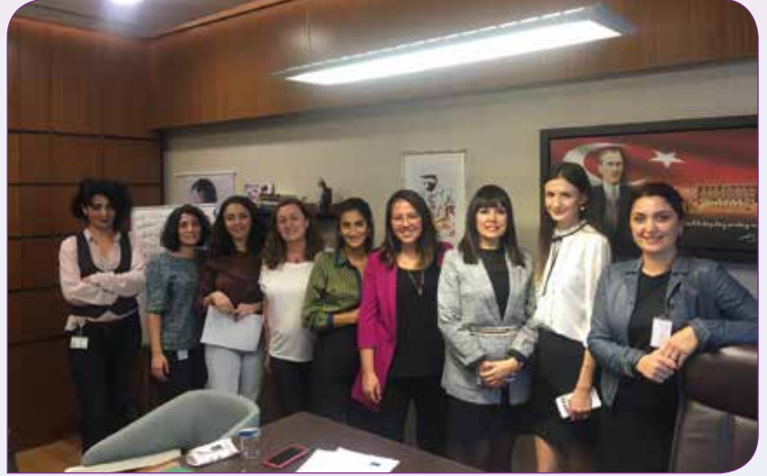
Nafaka Hakkı Kadın Platformu siyasi parti temsilcileri ile yaptıkları görüşmelerden birinde

esas niyet çok açık: Devletin, kadınları her türlü şiddet ve ayrımcılık karşısında yalnız bırakması.