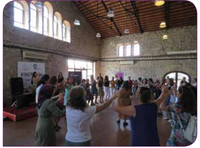
KİHEP Şenliği katılımcıları dans ederken