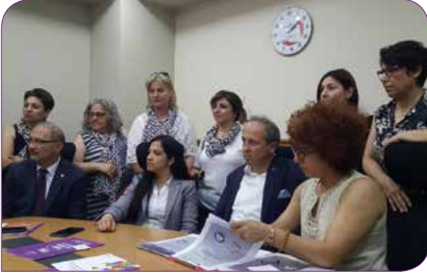
Avcılar Belediyesi ile KİHEP protokolü imzalanırken

Derneği'nin ev sahipliğinde İzmir'de KİHEP katılımcıları, eğiticilerimiz ve ortaklarımızın katılımıyla KİHEP Şenliğini gerçekleştirdik. Hemen akabinde KİHEP eğiticilerimizin katıldığı üç gün süren bir Buluşma ile hasret giderdik, motivasyonumuzu artırdık.