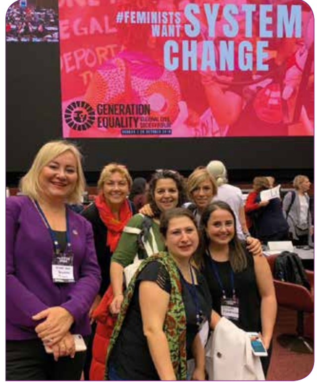
UNECE Pekin+25 Bölgesel Toplantısına Türkiye’den katılan kadınlar

Birleşmiş Milletler 4. Dünya Kadın Konferansı’nın 25.yılı (Pekin+25) sürecini yerel, bölgesel ve küresel düzeyde izlemek ve kadın haklarının izlenmesi için Küresel Bağımsız Kadın Kuruluşu ihtiyacını gündemleştirmek üzere Pekin+25 Türkiye Kadın Platformunun Politika Tutum Belgesi’ni Cenevre’deki bölgesel toplantıda hükümet delegasyonlarıyla, uluslararası kadın hareketiyle ve Birleşmiş Milletler Kadın Birimiyle paylaştık. Önerdiğimiz bağımsız kadın kuruluşuna ilgi yoğununda ve çok olumlu geri dönüşler aldık. Buna ek olarak, dünyada yükselen toplumsal cinsiyet karşıtı ve hak karşıtı akım ve hareketlere dair analizleri ve mücadele yöntemlerini içeren bir tutum belgesi oluşturduk ve bu konun bir oturumda tartışılmasını sağladık. Tutum belgesini geliştirmek ve yapılandırmak adına çalışmalarımız devam ediyor. Mart ayında gerçekleşecek Kadının Statüsü Komisyonuna ve sonrasında düzenlenecek küresel forumlara Pekin+25 Türkiye Kadın Platformu olarak Türkiye kadın hareketinin sesini taşımaya devam edeceğiz. Türkiye’den çıkan Küresel Bağımsız Kadın Kuruluşunu tüm dünyadaki feministlerle tartışarak, eşitlik, özgürlük ve adalet talebimizin yerine gelmesi için çalışmaya devam edeceğiz.