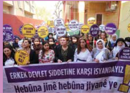
Emine Bulut eylemi, Trabzon

Kadınlar Birlikte Güçlü ise 25 Kasım yaklaşırken “Kadın Cinayetlerini Acil Önle” kampanyasına başladı. Kampanya kapsamında Kadıköy İskele Meydanı’nda bir araya gelen kadınlar, öldürülen 100 kadının hikayesini paylaştı. Gerekli önlemlerin alındığı koşullarda kadın cinayetlerinin önlenilebileceğini vurgulanan eylemde ayrıca şu açıklama yapıldı: “Kampanya boyunca farklı şekillerde bu cinayetlerin ve cinayete varana dek erkek şiddetinin nasıl önlenilebileceğini anlatmaya çalışacağız. İddia ediyoruz: İstanbul Sözleşmesi ve 6284 etkin bir şekilde uygulanırsa, yeterli sığınak, kadın danışma/dayanışma merkezi ve tecavüz kriz merkezi açılırsa, toplumsal cinsiyet eşitliği tanınır ve politika metinlerinden çıkarmaktan vazgeçilirse, kadınların ekonomik hakları güvence altına alınır ve sosyal politikalar aileye bağlı olmadan çıkarılırsa, toplumda şiddete karşı ‘karı-koca arasına karışılmaz’ diyerek yok saymak yerine müdahale etme yaklaşımı yaygınlık kazanırsa kadın cinayetleri önlenir. Bu yüzden buradan politika yapanlara, uygulayanlara, mahkemelere, kolluk kuvvetlerine, yan komşulara, akrabalara, sokaktan geçenlere, yani herkese sesleniyoruz: ‘Kadın cinayetlerini acil önle!’ Ve bunun mümkün olması