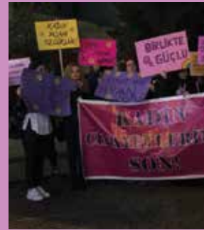
25 Kasım 2019, Yalova

Birleşmiş Milletler (BM) Kadın Birimi tarafından yıllık olarak hazırlanan ve bu seneki başlığı "Değişen Dünyada Aile" olan Dünya Kadın İlerleme Raporu yayımlandı. Araştırmalar raporunda, kadınlar için en tehlikeli yerlerden birinin kendi evleri olduğu belirtildi. 2017'de işlenen kadın cinayetlerinin yüzde 60'a yakınında, katilin, aile üyelerinden biri olduğunu gösteren rapora göre, her gün 137 kadın aile fertlerinden biri tarafından öldürülüyor. Rapor ayrıca 15-49 yaş arasındaki her 5 kadından birinin, eskiden veya şu anda birlikte olduğu eşi/partneri tarafından uygulanan fiziksel şiddete veya cinsel istismara uğradığını ortaya koyuyor.