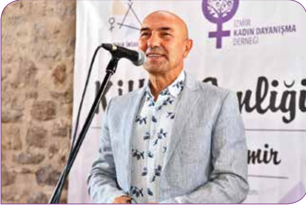
İzmir Büyükşehir Belediye Başkanı Tunç Soyer

Bizler için kadınlarla bir araya gelmek, buluşmak, tanışmak, eğlenmek, birbirimizle daha yakın iletişim ve temas halinde olmak her zaman çok kıymetli oldu. Bu yüzden kaynaklarımız el verdiği ölçüde bu buluşmaları gerçekleştirmeye çalıştık, çalışıyoruz. Son olarak KİHEP'in en yaygın uygulandığı il olan İzmir'deki katılımcılar, eğiticilerimiz ve ortaklarımızın da isteğiyle kadınlarla bir araya geleceğimiz bir buluşma etkinliği yapmaya karar verdik. İzmir Kadın Dayanışma Derneği ile işbirliği içinde Şenlik şeklinde organize ettiğimiz etkinliğimize KİHEP'li kadınlar, bazı eğiticilerimiz ve işbirliği yaptığımız ortaklarımızın temsilcileri katıldı. İzmir Büyükşehir Belediyesine ait Havagazı Kültür Merkezinde 7 Eylül tarihinde yaklaşık 450 kişinin katılımıyla gerçekleştirdiğimiz Şenliğimiz, İzmir'de birbirini tanımayan KİHEP'li kadınların tanışmalarını ve kaynaşmalarını sağladı.