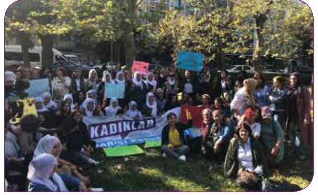
"Kadınlar Barışı Konuşuyor" etkinliği

Yapılan çalışmalarda bütün kadınları kapsayıcı hizmet anlayışından uzak bir anlayış söz konusu. Ailelerinin farklı görüşe sahip olduğuna inanılan kadınlara verilen hizmetlere son verilmesine yönelik girişimlerde bulunuluyor. Toplumda gruplaşmaya ve ayrımcılığa neden olan yaptırım ve uygulamalar mevcut. İnsanlar arasındaki iletişime zarar veriyorlar ve bunun sonucunda kişiler arasında kırılmalar ve tartışmalar yaşanıyor. Yerel halkın istihdamı yerine başka illerden özellikle getirilen kişiler istihdam ediliyor. İŞKUR üzerinden yapılan alımlarda ekonomik açıdan mağdur kadınlar işe alınmayarak emniyet mensuplarının eşlerine öncelik veriliyor. Toplumun manevi ve kültürel değerlerine önem vermek yerine yöneticilerin kişisel beğenilerine önem veriliyor ve bunun yansımalarını da şehir mimarisinde görebiliyoruz. Kayıym uygulamaları sonucunda belediyelerde çalışan ve belediyenin hizmet ulaştırması gereken kadınlar doğrudan ve dolaylı olarak birçok mağduriyet yaşadığı ve yaşamaya devam ediyor.