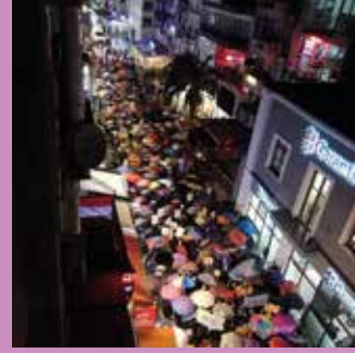
25 Kasım 2019, İzmir