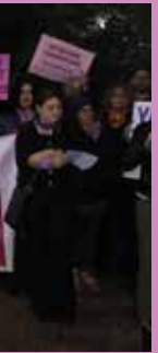
25 Kasım 2019, Kayseri