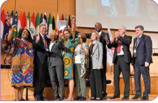
İş yerinde şiddet ve tacizle mücadeleyle yönelik yeni Sözleşme'nin kabul edilmesinin ardından