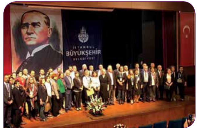
İstanbul Kent Konseyi Üyeleri