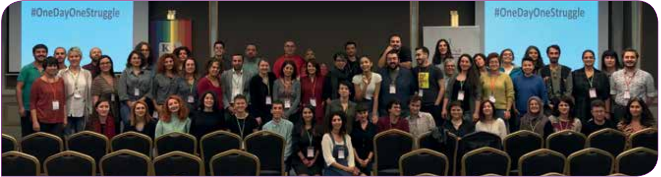
"Dayanışma Yaşatır Çalıştayı" katılımcıları

Nafaka Hakkı Kadın Platformu olarak bir hak olan kürtajın bir fişleme aracı olarak kullanılmasını, kadınların kişisel sağlık verilerinin üçüncü taraflarla paylaşılmasını kabul etmeyeceğimize dair bir bildiri yayınladık. Birçok kadın örgütünün ve İstanbul Tabip Odası'nın itirazları sonuç verdi ve 12 Eylül tarihinde İstanbul İl Emniyet Müdürlüğü "Talep edilen bilgi gereksinimi ortadan kalktığından söz konusu yazımıza işlem tesis edilmemesi" içerikli ikinci bir yazıyla talebini geri çekti. Kadınlar olarak bir kez daha haklarımızın geri alınmasına karşı dayanışmamızı ördük ve haklarımızı korumayı başardık.