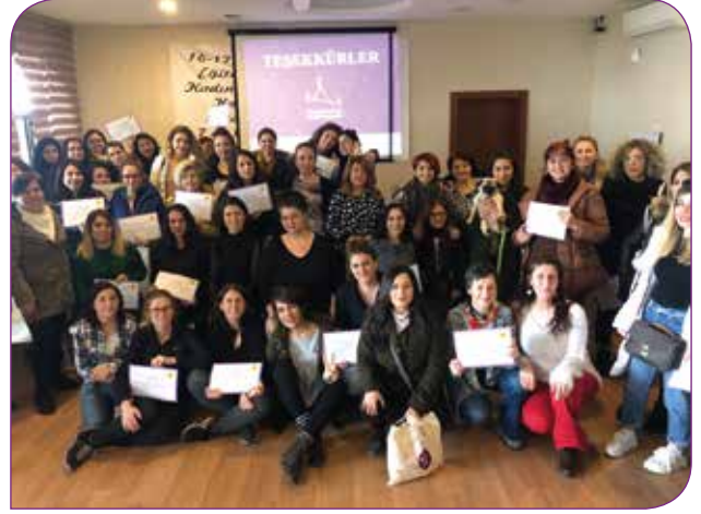
Eğitim-Sen 1 ve 7 Nolu Şubeleri ile gerçekleştirilen TCE Seminerinden

Bu kapsamda Ege Kadın Buluşması bileşeni kadın örgütleriyle Manisa, İzmir, Denizli ve Aydın'da 4 ayrı TCE Seminerini Ekim ayında ve İzmir'de tekstil sektöründe çalışan fabrika işçisi kadın ve erkeklere yönelik 3 semineri geçtiğimiz Nisan ayında gerçekleştirdik. Bunların yanı sıra Çanakkale Koza Gençlik Derneği ile Şiddetsiz İletişim