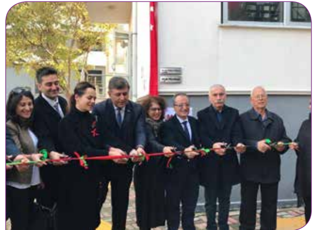
İnsan Hakları Birimi ve Hak Merkezinin açılışı