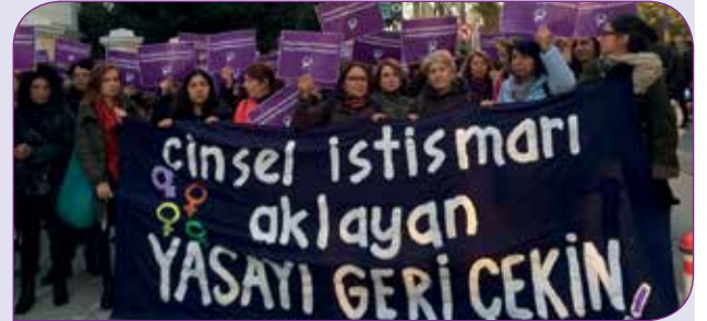
TCK 103 cinsel istismar yasa düzenlemesine karşı kadınların eylemi

çocuk yaşta, erken ve zorla evlendirmelerin önünü açmayı hedefleyen bu önergeye, milyonlarca kadını birlikte karşı çıkmıştık. 2016’dan bu yana yayınladığımız sayısız bildiri de belirttiğimiz üzere böyle bir düzenleme Türkiye’nin taraf olduğu çocuk hakları ve kadın hakları ile ilgili sözleşmelere ve Anayasa’ya aykırıdır, çocuk istismarcılarına af konusu tekrar tekrar gündeme getirilmemelidir!