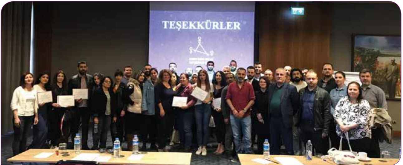
Tekstil sektörü çalışanlarıyla gerçekleştirilen TCE Semineri'nden