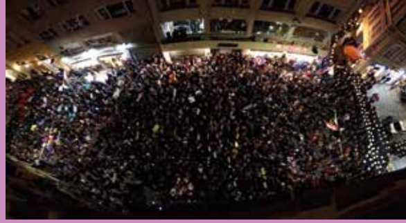
25 Kasım 2019, İstanbul