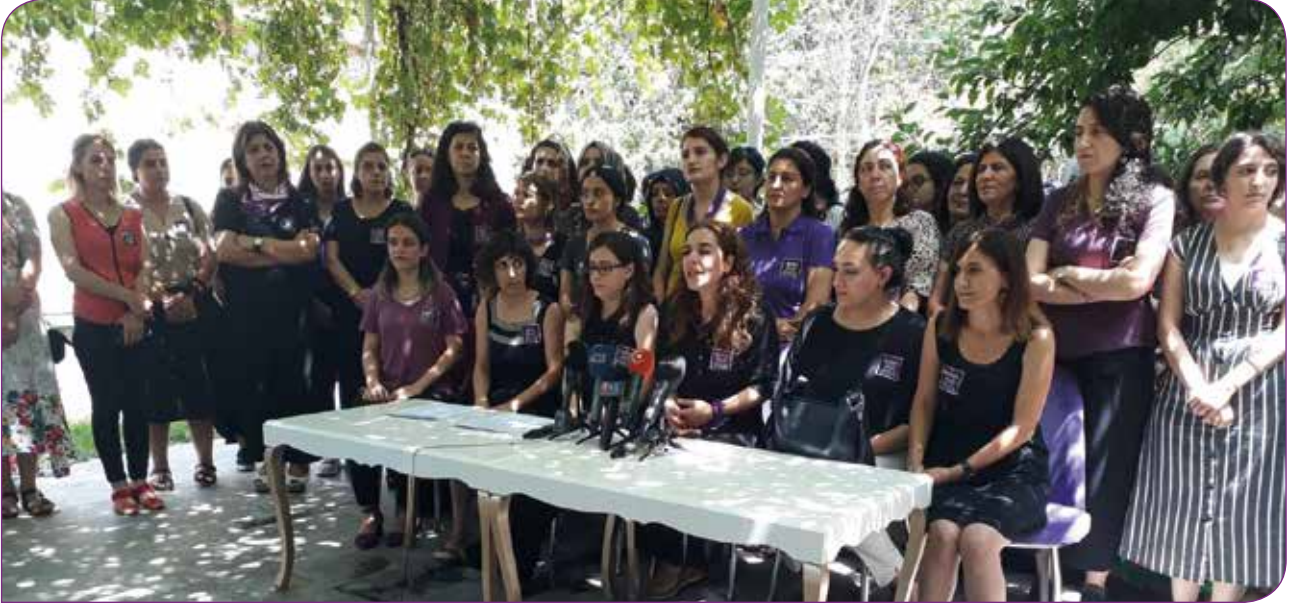
Rosa Kadın Derneği basın açıklaması sırasında

ediyor. Bu çalışmanın sonucunda hem şehrin antenleri görevini yerine getirip şiddetle etkin mücadele etmeyi hem de şehrin şiddet haritasını oluşturmayı amaçladık. Bu çalışma uzun vadede hem şiddeti önlemede etkin ve sonuç odaklı bir mücadelenin sürmesini hem de gerçek verilere ulaşmamızı sağlayacak. Ayrıca periyodik olarak iki ayda veya üç ayda bir şiddet ağının yaptığı her çalışmayı basın önünde kamuoyu ile paylaşma kararı aldık.