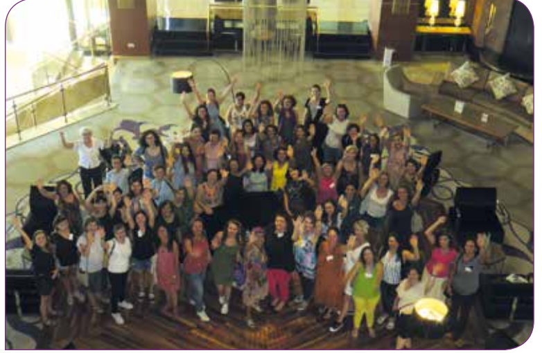
KİHEP Eğitici Buluşmamızda eğitimcilerimizle

Buluşmada ayrıca birbirine paralel iki ayrı oturum gerçekleştirdik. Oturumlardan birinde eğitimcilerimizin sosyal medya kullanımını dahil, dijital uygulamalar