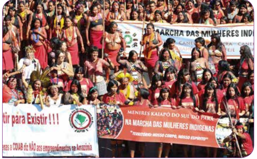
Brezilyalı kadınlar sokaklarda

Bu yılki protestolar, diğer konuların yanı sıra, aşırı sağcı Devlet Başkanı Jair Bolsonaro'nun cinsiyetçi ve ırkçı politikalarına odaklandı. Jair Bolsonaro, erkeklerle kadınların eşit ücret almasına karşı ve ayrıca iklim değişikliğiyle mücadele için ayrılan paranın kısıtlanmasını istiyor. Brezilya'nın başkenti Brasilia'da çoğu kadın 100 binden fazla kişi sokaklardaydı. Bolsonaro'nun politikalarına karşı protestolar Brezilya ile sınırlı değil. Özellikle Bolsonaro'nun Amazon Ormanları'na yönelik müdahaleleri uluslararası sivil toplum kuruluşları tarafından da kınanıyor ve Bolsonaro hükümetinin küresel çapta eleştirilmesine sebep oluyor.