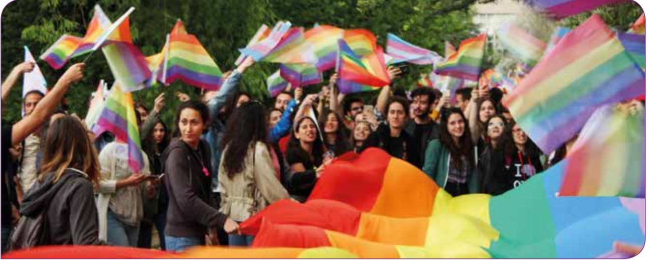
Ankara'da ODTÜ'lü öğrencilerin Onur Yürüyüşü

KAOS GL - Kaos Gey ve Lezbiyen Kültürel Araştırmalar ve Dayanışma Derneği