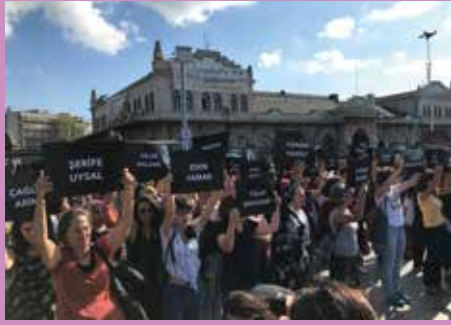
Kadın Cinayetlerini Acil Önle Eylemi, Kadıköy – İstanbul