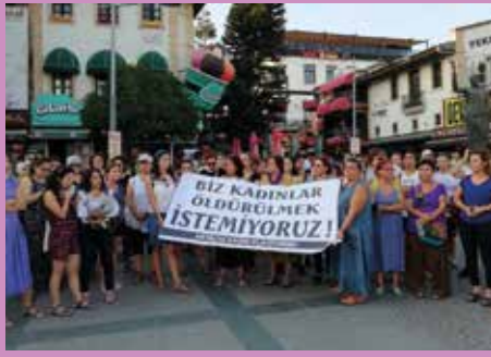
Emine Bulut eylemi, Antalya