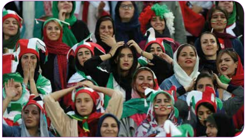
İranlı kadınlar stadyumda

40 yıldır süren kadınların stadyuma giriş yasağına, başta FIFA olmak üzere dünya spor kamuoyu ve Devlet Başkanı Hasan Ruhani de karşı çıkıyordu. FIFA Başkanı Gianni Infantino, kadınların stadyumlara girişinin önündeki