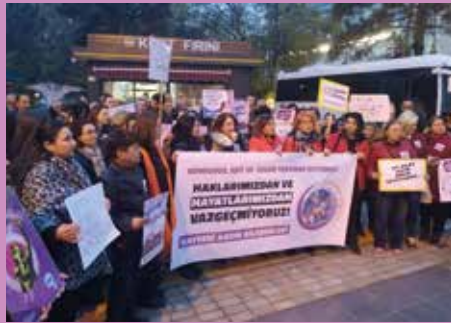
25 Kasım 2019, Mardin