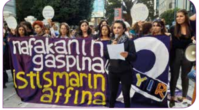
Yoksulluk nafakası ve çocukların cinsel istismarı konuları ile ilgili kadınların aleyhine yapılmak istenen yasa değişikliklerine karşı Kadıköy’de düzenlenen eylem

İstanbul Sözleşmesi, kadına yönelik şiddetin önlenmesinin toplumsal cinsiyet eşitliğinin sağlanmasıyla gerçekleşeceğini vurguluyor. Toplumsal cinsiyeti, herhangi bir toplumun, kadınlar ve erkekler için uygun olduğunu düşündüğü sosyal anlamda oluşturulmuş roller, davranışlar, faaliyetler ve özellikler olarak tarif ediyor. Sözleşme, imzacı ülkelerin, kadınların daha aşağı düzeyde olduğu düşüncesine veya kadınların ve erkeklerin toplumsal olarak klişeleşmiş rollerine dayalı ön yargıların, törelerin, geleneklerin ve diğer uygulamaların kökünün kazınması amacıyla kadınların ve erkeklerin sosyal ve kültürel davranış kalıplarının değiştirilmesine yardımcı olacak tedbirlerin alınması yükümlüğünü düzenliyor.