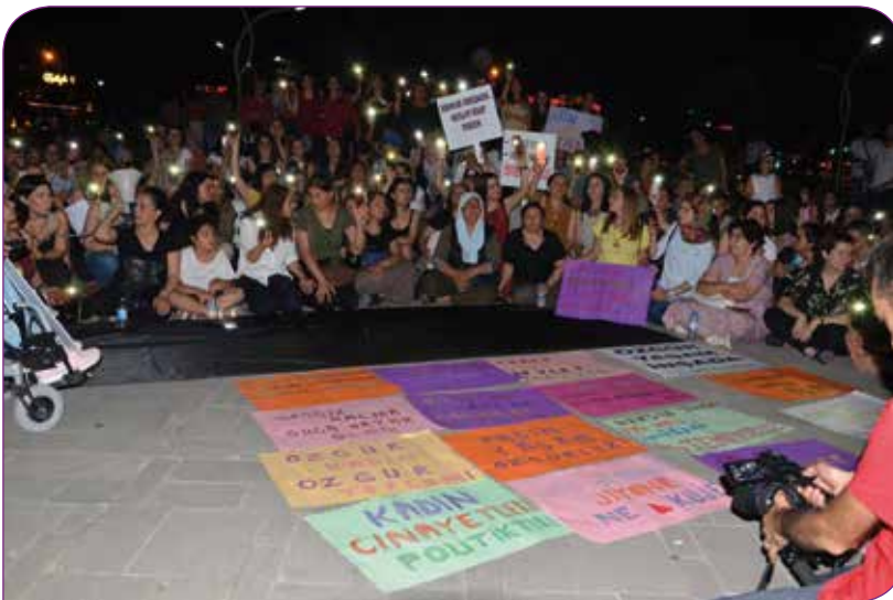
Rosa Kadın Derneğinin bir eyleminden