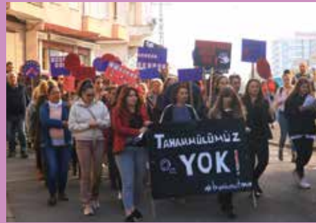
25 Kasım 2019, Rize