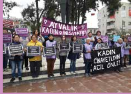
Kadın Cinayetlerini Acil Önle Eylemi, Ayvalık – Balıkesir 25 Kasım 2019, Ankara