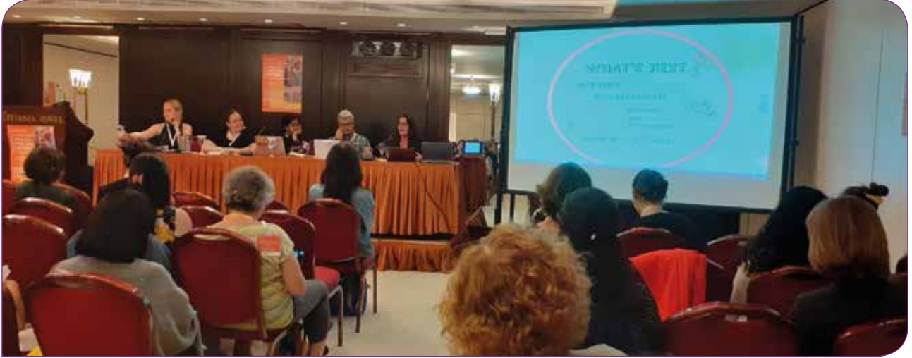
Inspire Konferansı, Atina

Şimdiye kadar 493 genç, dijital üniversite adı verilen bu savunuculuk eğitimini tamamlamış, gençlerin ürettiği 93 yerel proje desteklenmiş ve aynı zamanda 513 genç lider Women Deliver 2019 Konferansı'na burslu olarak katılmış. Otuz yaş altı herkese açık olan bu programla ilgili daha fazla bilgi için https://womendeliver.org/youth/ adresini ziyaret edebilirsiniz.