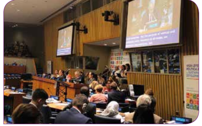
Türkiye 2. Gönüllü Ulusal Gözden Geçirme Raporu'nu sunarken

2030 yılına kadar ülkelerin sosyal, ekonomik ve çevresel alanlarda erişmeleri hedeflenen Sürdürülebilir Kalkınma Hedefleri (SKH), Temmuz ayında gerçekleştirilen Yüksek Düzey Politik Forum'da gözden geçirildi. Forum kapsamında Türkiye, 2. Gönüllü Ülke Raporu'nu sundu. Sunumda SKH'lerin Türkiye'de en üst düzeyde sahiplenildiğini ve paydaş katılımına önem verildiği vurgulandı. SKH'nin politikalara entegre edildiği belirtilse de, toplumsal cinsiyet eşitliği konusuna sunumda yer verilmedi. Sunumun ardından tanınan kısıtlı zamanda söz alan sivil toplum temsilcileri ise Türkiye'de kadınların yasal hakları ile gündelik hayatta bu hakların kullanımı arasındaki uçuruma dikkat çekti. Toplumsal cinsiyet eşitliğine muhalefet eden grupların saldırıları ve siyasi irade eksikliğinin kadınların ve kız çocuklarının haklarına ulaşmalarını gitgide engellediği vurgulandı. Ayrıca sivil toplum sözcüleri Türkiye'nin 11. Kalkınma Planı'ndan, daha önceki planlarda yer alan "toplumsal cinsiyet eşitliği" kavramı ve kapsamının çıkarılmasının vahametine değinerek, bu yaklaşımla 2030 yılına kadar SKH'ye ulaşmanın imkansız olacağını belirttiler.