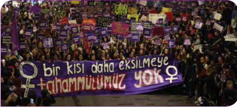
25 Kasım 2019, İstanbul

İnfaz yasasının yürürlüğe girmesinin ardından 156 kadın örgütünün kadına yönelik şiddetle mücadele konusunda devletin alması gereken tedbirlere yönelik yayınladığı metni aşağıda okuyabilirsiniz: