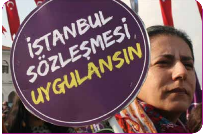
Kadınların düzenlediği bir eylemden

Mor Çatı Kadın Sığınağı Vakfı, koronavirüs salgın koşullarında kadına yönelik şiddet mekanizmalarının nasıl çalıştığına dair izleme yaparak bu süreçte kamuoyu ile 3 farklı rapor paylaştı. Raporlarda salgın döneminde karşı karşıya kalınan sorunların sadece bu döneme özgü olmadığı özellikle belirtilerek uygulamada hali hazırda devam eden sorunların tekrarlanmasında salgının bir bahane olarak kullanıldığını gördüklerini ve salgın koşullarının kadınların içinde buldukları koşulları daha da güçleştirdiğine şahit olduklarını vurguluyorlar. Öne çıkan bazı ihlalleri Mor Çatı'nın raporlarından alıntılarla şöyle sıralayabiliriz: