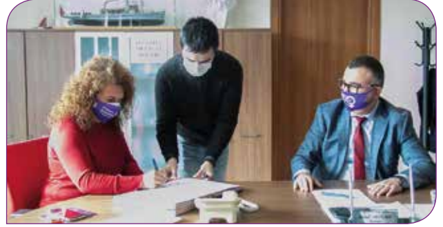
Derneğimiz Çanakkale Belediyesi ile protokol imzalarken