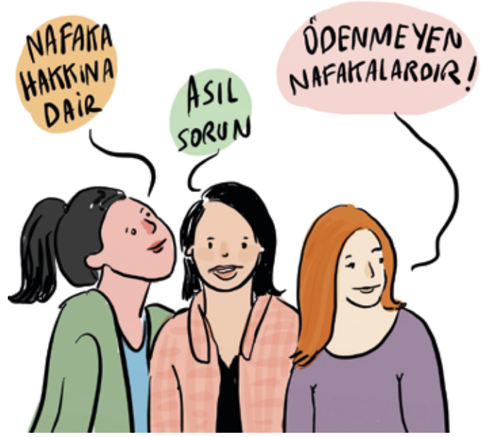
İllüstrasyon: Aslı Alpar

Araştırma raporunda ayrıca, Kadın Dayanışma Vakfı'nın 140 dava dosyası örneğinde hazırladığı yoksulluk