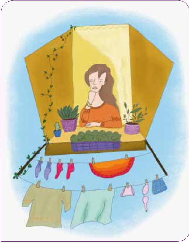
İllüstrasyon: Ceren Suntekin

sonlanmasını istemekte ve buna yönelik çözüm yolları aramaktadır. Bu nedenle “şiddet döngüsü” uzun süre devam etmektedir. Araştırma bulgularında iletişim kurmanın dışında şiddetle baş etmede en çok kullanılan yöntemler “sakinleştirici kullanmak” ve “aile büyüklerine şikayet etmek” olarak bulgulanmıştır. Şiddet ile baş etme konusunda kadınlar, kurumsal çözümlere yönelmek yerine, kendileri tek başına çözüm bulmaya çalışmakta ya da çözümü aile kurumu içerisinde aramaktadır.