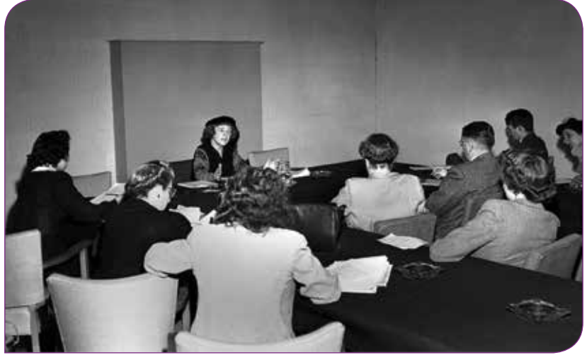
Kadının Statüsü Komisyonu'nun Şubat 1947’de gerçekleşen Lake Success New York’taki ilk toplantısı

İnsan Hakları Evrensel Bildirgesi’nin ortaya çıkışından 45 sene, CEDAW’ın kabul edilmesinden ise 14 sene sonra, 1993’te Dünya İnsan Hakları Konferansı Viyana’da gerçekleştirildi. Bu konferansa katılan kadın hakları aktivistleri, dünya çapında tüm uluslararası insan hakları mekanizmalarına rağmen gerçekleşen kadına yönelik insan hakları ihlallerinin tarihsel olarak hiçe sayıldığını ifade ettiler ve “Kadın hakları, insan haklarıdır!” sloganıyla konferansa damgalarını vurdular. Özellikle kadına yönelik şiddet konusunu gündemleştiren kurullar kurdular ve daha önce özel alan, tabu ya da kadınların yaşamlarının kaçınılmaz bir parçası olarak kabul edildiği için ele alınmamış olan kadın hakları ihlallerine dikkat çektiler. Konferans “kadınların ve kız çocuklarının insan haklarının evrensel insan haklarının devredilemez,