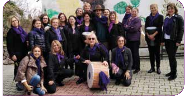
Urla Kadın Dayanışma Derneği Ritim Grubu

Urla Kadın Dayanışma Derneği'nin neredeyse tüm üyeleri KİHEP grup çalışmalarına katılmış kadınlar. Bunu ilerleyen süreçte de devam ettirmeyi amaçlıyoruz.