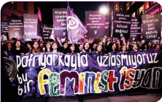
İstanbul'da düzenlenen 18. Feminist Gece Yürüyüşü ana pankartı / Kaynak: Sivil Sayfalar