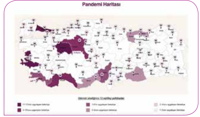
Kadın Koalisyonu'nun belirlediği izleme politikaları uygulayan belediyelerin haritası

Katılım mekanizması en büyük eksiklik olarak çıktı karşımıza. 30 belediye içinde neredeyse tek bir örnek var. Kadına karşı şiddetle mücadele mekanizmaları çok az belediyede etkin işletilmiş. Barınma desteği olan belediyeler var ve hayati bir destek, ama sayıları bir elin parmaklarını geçmiyor. İşsizlik ödeneğinden yararlanma şansı olmayanların büyük çoğunluğu kadın. Çünkü kadınların büyük kısmı günü birlik ya da güvencesiz işlerde çalışıyor. Ekonomik destek sunarken bunu göz ardı ederek hizmet sunarsanız, yoksullukla mücadeleyi herkesi kapsayacak şekilde yaptığınızı iddia edemezsiniz. Hijyen paketlerinde kadınlar için hijyen kitini öngören belediye de yine çok azdı.