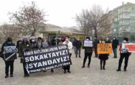
Malatya / Kaynak: Evrensel