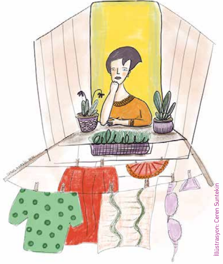
İllüstrasyon: Ceren Suntekin

Bu araştırma için KİH-YÇ ekibi profesyonel bir araştırma ekibi ile çalıştı. Araştırmanın tasarımında ve saha uygulamasında KİH-YÇ'nin çalışma ilkeleri ile feminist izleme değerlendirme yaklaşımı ilkeleri hayata geçirildi.