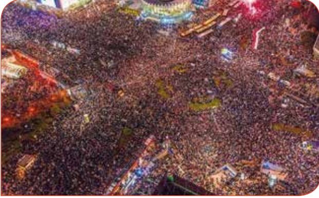
Anayasa Mahkemesi'nin kararının ardından Varşova'da gerçekleştirilen sokak eylemlerinden bir görüntü

uygulamaya konmasını erteledi. Geldiğimiz noktada, bu eylemlerin ülkedeki politik kültürü ve gidişatı kökten değiştireceği yorumları yapılıyor. Polonya'da kürtaj hakkı ve genel olarak toplumsal cinsiyet eşitliği için mücadele eden kadınlarla kurulan dayanışma, uluslararası düzeyde. Türkiye'de de feminist ve LGBTİ+ hareketler(i)nin yakından takip ettiği ve dayanıştığı süreçle ilgili bilgi ve deneyim paylaşımı için çeşitli online etkinliklerde Polonya'dan aktivistlerle bir araya gelindi.