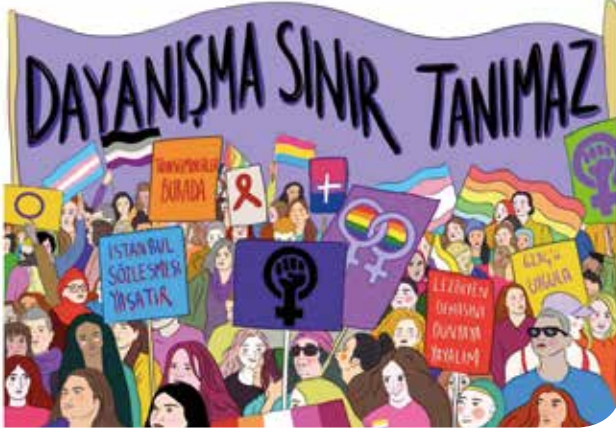
İllüstrasyon: Semih Özkarakaş