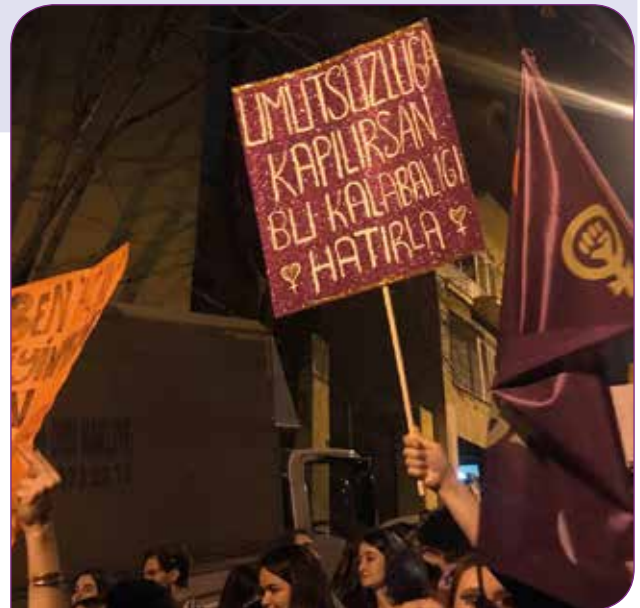
İstanbul'da düzenlenen 18. Feminist Gece Yürüyüşü'nden