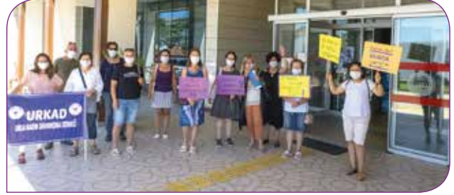
Urla Kadın Dayanışma Derneği'nin takip ettiği bir şiddet davası ardından yapılan açıklama

Kadınların haklarını bilmesi ve hakları için mücadele etmesi, güçlenmesi öncelik verdiğimiz bir alan, KİHEP'i de bunu sağlayan önemli bir araç olarak görüyoruz. Hem KİHEP özelinde hem de diğer hak mücadelesi alanlarında Kadının İnsan Hakları – Yeni Çözümler Derneği ile iş birliğimizi devam ettirmeyi amaçlıyoruz.