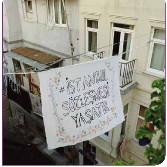
Yaz boyunca düzenlenen İstanbul Sözleşmesi Yaşatır kampanyasından

Sonrasında Meclisin kapanması ve TCK 103 konusunun ertelenmesini ile eşzamanlı olarak temmuz başında İstanbul Sözleşmesi'nden imzanın çekilmesi tehlikesi ciddi bir şekilde baş gösterdi. Hâlihazırda TCK 103 için bir araya gelme iradesi