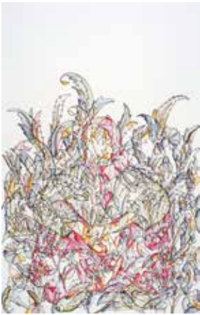
Burçak Bingöl – "Ana Tanrıça" (2016)

internet sitesi üzerinden değerinin altında satışı yapılan eserlerden elde edilen gelir kadınların şiddetten uzak bir yaşam kurmasına destek oldu. "Mor Çatı için Sanat Dayanışması" kapsamında satışı yapılan eserlerden bazılarını sizler için seçtik.