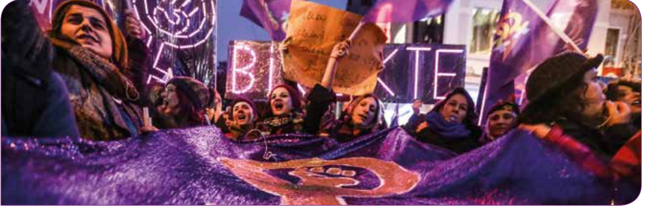
18. Feminist Gece Yürüyüşü, İstanbul

Tüm dünya ve Türkiye Covid-19 salgını ile mücadele ederken, Diyanet İşleri Başkanlığı, ülke genelinde tüm camilerde okunan 24 Nisan 2020 tarihli hutbesinde LGBTİ+'ları, HIV'le yaşayanları ve evlilik dışı ilişki yaşayanları "Ey insanlar! İslam zınyayı en büyük haramlardan kabul ediyor. Lûtîliği, Eşcinselliği lanetliyor. Nedir bunun hikmeti. Hastalıkları beraberinde getirmesi ve nesli çürütmesidir, bunun hikmeti. Yılda yüzbinlerce insan gayri meşru ve nikahsız hayatın İslami literatürdeki ismi zina olan bu büyük haramın sebep olduğu HIV virüsüne maruz kalıyor. Geliniz bu tür kötülüklerden insanları korumak için birlikte mücadele edelim," sözleriyle hedef gösterdi. Diyanet'in LGBTİ+'ları, HIV'le yaşayanları ve evlilik dışı ilişki yaşayanları hastalıklardan sorumlu tuttuğu hutbesi tüm Türkiye'de ve dünyada tepkiyle karşılandı.