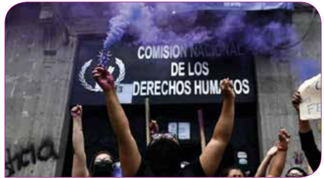
Feministler, Mexico City'deki Ulusal İnsan Hakları Komisyonu binasını işgal etti.

Yine Eylül ayında, Hindistan 'da da kadınlar, tecavüz ve kadın cinayetlerinin durdurulması talebiyle sokağa çıktı. 14 Eylül'de Uttar Pradeş eyaletinde, ülkedeki en alt sınıfı temsil eden Dalit kastına mensup 19 yaşında bir kadın 4 erkek tarafından toplu tecavüze uğradı ve yaralandı. Cinsel ve fiziksel saldırıya uğrayan kadın, ağır yaralı olarak transfer edildiği Yeni Delhi'deki hastanede 2 hafta sonra hayatını kaybetti. Saldırığı gerçekleştiren erkeklerin, daha önce de Dalit kasti mensuplarına karşı işledikleri suçlar bulunduğu iddialar arasında. Eylül ayının sonunda, yine aynı bölgeden ve aynı kasta mensup 22 yaşındaki başka bir kadın daha bir grup tarafından tecavüz edilerek öldürüldü. Yeni Delhi, Mumbai gibi büyük şehirlerin de aralarında bulunduğu şehirlerde, hükümetin tecavüzlere ve kadın cinayetlerine karşı ciddi önlemler alması talebiyle protestolar düzenlenmeye devam ediyor. 19 yaşındaki kadının hayatını kaybettiği hastanenin önündeki protestolarda, pandemi önlemlerinin ihlal edilmesi gerekçesiyle gözaltına alınanlar oldu. Hükümetin Ocak'ta yayınladığı son verilere göre, 2018 yılında ülkede her 15 dakikada bir kadın tecavüze uğradı.