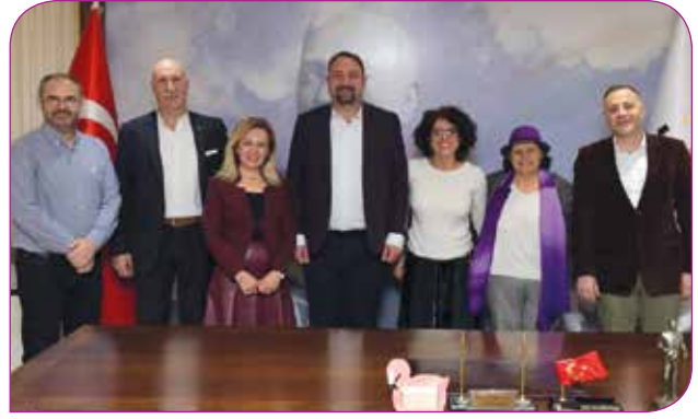
Çiğli Belediyesi ile derneğimiz protokol imzalararken

Daha önce de sizlere bilgisini verdiğimiz gibi, KİHEP tarihinde ilk defa bir fabrikada kadın çalışanların mesai saatleri içinde katıldıkları bir KİHEP grup çalışması başlattık. Salgın sebebiyle tamamlamadığımız bu grup çalışmasını, Manisa’da bulunan Sun Tekstil şirketi ile iş birliği içinde