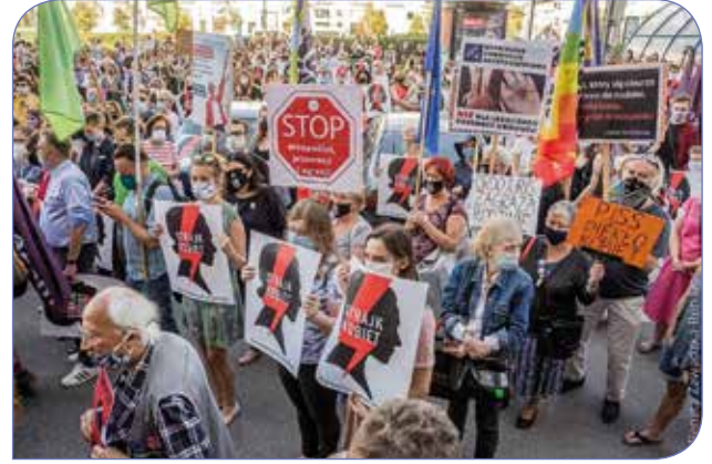
Temmuz ayında, hükümetin İstanbul Sözleşmesi'nden çıkmaya yönelik gündemine karşı Varşova'da gerçekleştirilen protestolardan bir görüntü

Duda'nın seçilmesiyle, hükümetin 2015'te başlattığı muhafazakâr atağa devam edeceği, yargı bağımsızlığının kaybolacağı, basın özgürlüğünün daha da engelleneceği ve ülke içindeki sert kutuplaşmanın artacağı öngörülerinin olduğu bir politik atmosfer içerisinde İstanbul Sözleşmesi'nden çekilme tartışmaları başlatıldı. Bunun hemen öncesinde Polonya'da LGBTİ+'sız Alan (LGBTİ+ Free Zone) isimli, LGBTİ+'ların insan haklarını ihlal eden protokolü imzalamış olan 100 kadar belediye arasından Avrupa Birliği'ne fon başvurusunda bulunan