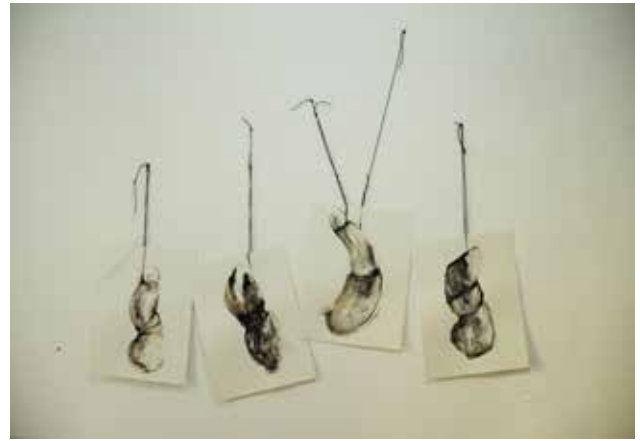
İris Ergül – "Lunatic Phases xxx" (2014)