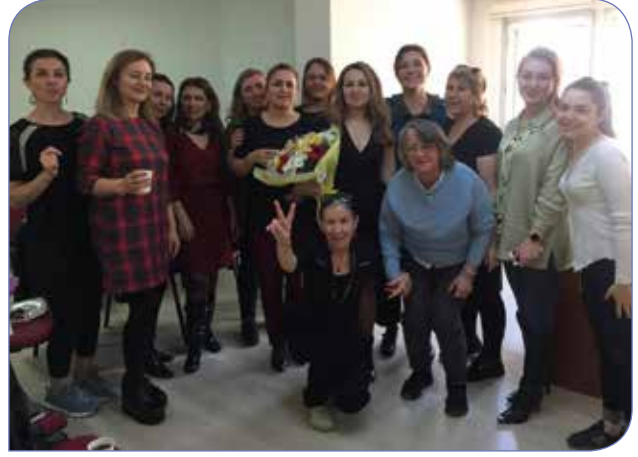
KİHEP Sertifika Töreni esnasında