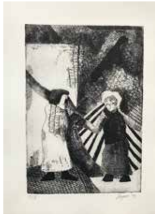
Zeyno Pekünlü – "İsimsiz" (2002)