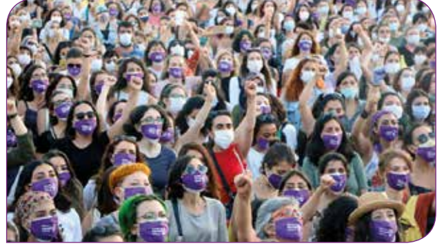
Ağustos ayında düzenlenen İstanbul Sözleşmesi'ni Uygula Eylemi, Kadıköy

Kampanyanın ilk ayağı sözleşmenin yürürlüğe girmesinin yıldönümü olan 1 Ağustos'ta bir sosyal medya eylemiydi.