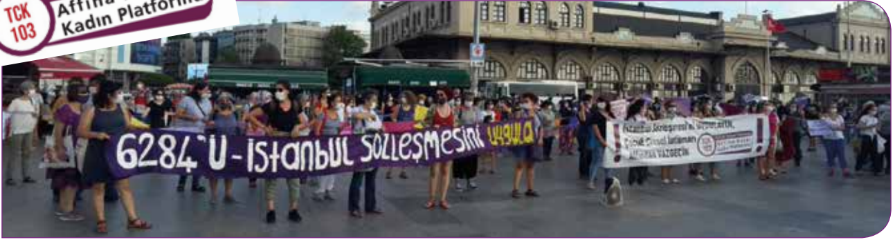
Çocuk Cinsel İstismarı Affından Vazgeçin Eylemi, Kadıköy