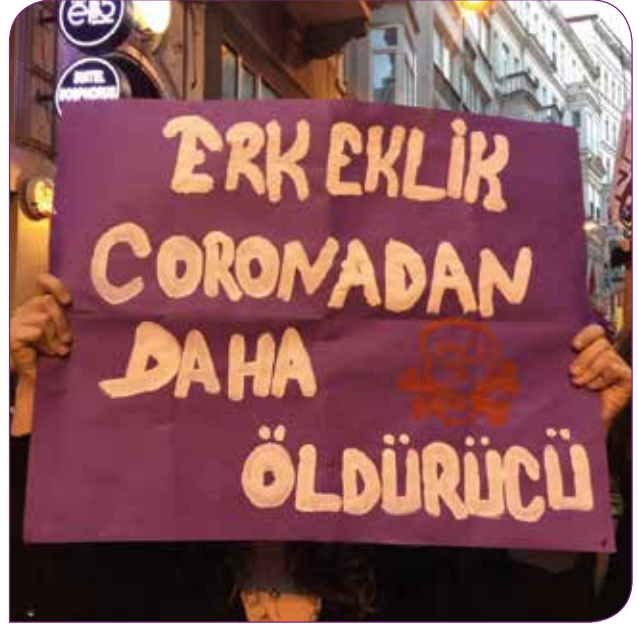
18. Feminist Gece Yürüyüşü, İstanbul

Kriz dönemleri, hukukun askıya alındığı ya da çoğunlukla hukuk eliyle hak ve özgürlüklerin anti-demokratik şekilde kısıtlandığı dönemlerdir. Tarih, baskıcı yönetimlerin, krizin yarattığı korku ve panikten yararlanarak hukuku araçsallaştırmasının örnekleri ile dolu. Bu anlamda kriz dönemi hukukunun, bir "demokrasi turnusolu" olduğunu söylemek hata olmaz.