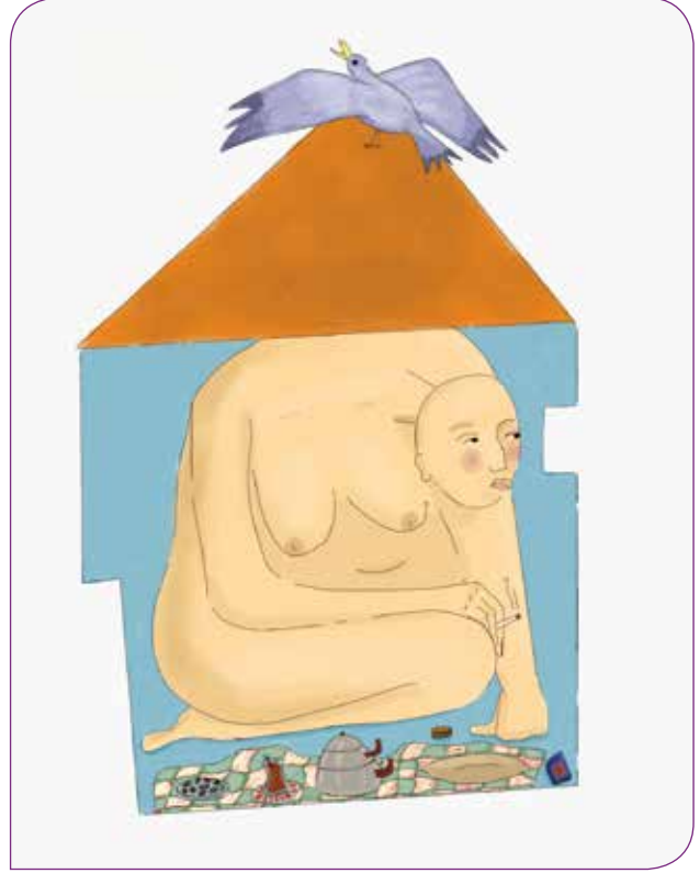
İllüstrasyon: Ceren Suntekin

Covid-19 salgını süresince kadınların yüzde 7'si cinsel sağlık ve doğurganlık sağlığı ile ilgili jinekologa gitme