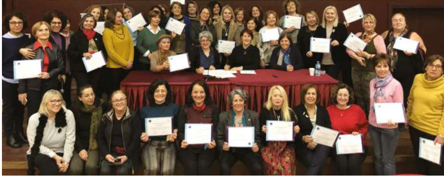
Türk Üniversiteli Kadınlar Derneği ile İşbirliği Protokolü imzalarken