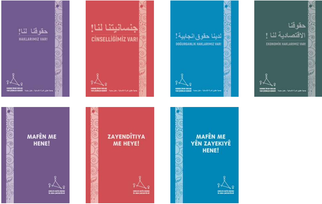
1. Haklarımız Var! (Türkçe, Kürtçe ve Arapça) 2. Cinselliğimiz Var! (Türkçe, Kürtçe ve Arapça) 3. Doğurganlık Haklarımız Var! (Türkçe ve Arapça) 4. Ekonomik Haklarımız Var! (Türkçe ve Arapça)

“Bu eğitimin arkasından kendi işyerimi açmak ya da ücretli işte çalışmak ve ekonomik özgürlüğüme kavuşmak istiyorum ,,