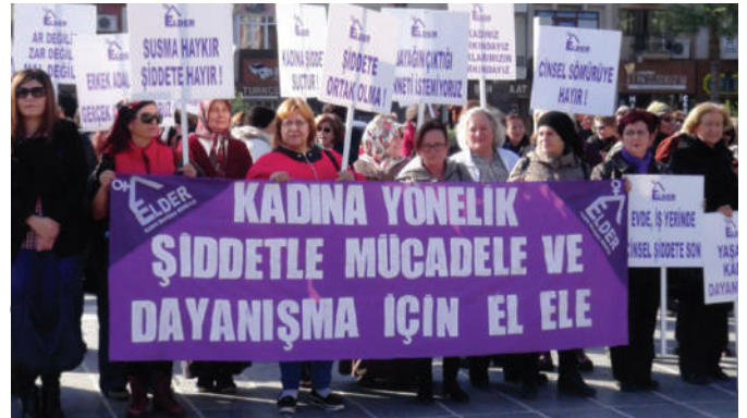
Çanakkale Kadın El Emeği Değerlendirme Derneği'nden kadınlar

KİH-YÇ doğal ortakları olarak gördüğü yerel kadın örgütleriyle kalıcı işbirlikleri kurmaya özel çaba sarf eder ve sadece KİHEP uygulamaları konusunda değil, aynı zamanda ulusal ve uluslararası kadın ağlarında birlikte hareket etmeye de öncelik verir. Yerel KİHEP uygulamaları, özellikle de daha önce hiçbir kadın örgütünün olmadığı yerlerde yeni ve bağımsız kadın örgütlerinin kurulmasında çok etkili oldu. Ayrıca, KİHEP'li kadınlar var olan kadın örgütlerinin gelişmesine de katkıda bulundu. Bu örgütlenmeler genelde daha sonra KİH-YÇ'nin kurumsal ortağı haline gelerek üyelerinden birini veya birkaçını KİHEP uygulamaya başladı. Şu ana kadar onlarca kadın örgütüyle kurulan bu işbirlikleri kadınların yerelde güçlenmesine katkıda bulunmaya devam ediyor.