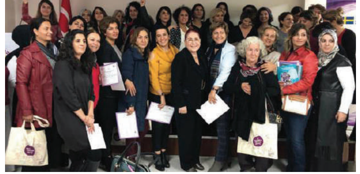
Doğu ve Güneydoğu İş Kadınları Derneği'nden kadınlar